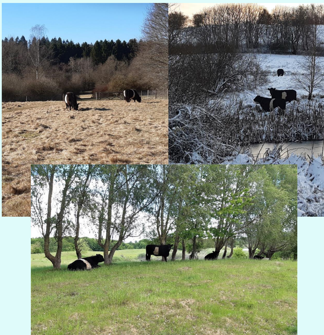
Figur 2 – 3 af de 4 årstider i Kildesvinget