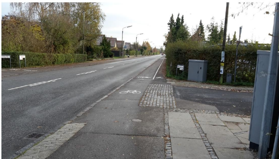
Figur 3: Ejbyvej ved Hasselvej set mod syd med overgang fra cykelsti/fortov til delte stier

Der foreslås at etablere en 2-minus-1 vej mellem Hasselvej og Åbyvej, så cyklister flyttes til kørebanen på brede kantbaner i stedet for delte stier, hvilket skaber mere tryghed for fodgængere og bedre oversigt til cyklister ved udkørsel fra sideveje og indkørsler. Desuden vurderes hastighedsniveauet erfaringsmæssigt at falde op til 5 km/t.