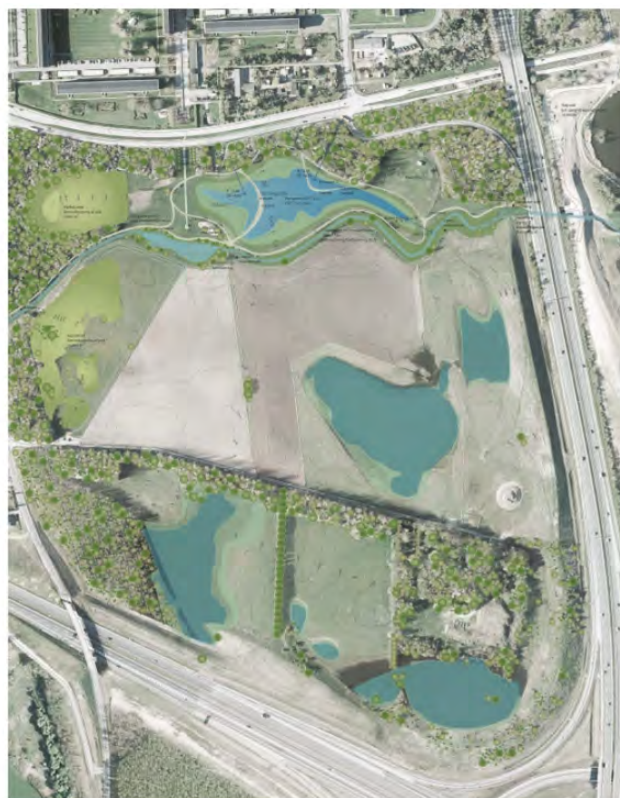
Figur 2. Projektets placering, detail

Regnvandsbassinet rummer 21.000 m 3 regnvand og udformes som en sø, der samtidigt tilfører området nye muligheder for oplevelser for borgerne og nye levesteder for dyr og planter. Hvis regnen overstiger en såkaldt 5 års hændelse (regn, der statistisk optræder én gang hvert femte år) løber vandet over bassinkanten og ned i Harrestrup Å. Samtidigt lukker slusen, hvorefter vandløbet og arealerne omkring langsomt oversvømmes. Hvor stort et areal der oversvømmes, afhænger selvsagt af, hvor meget det regner. Hvis det regner mere end en 100 års hændelse, vil vandet løbe over slusens kant og videre ned gennem Harrestrup Å.