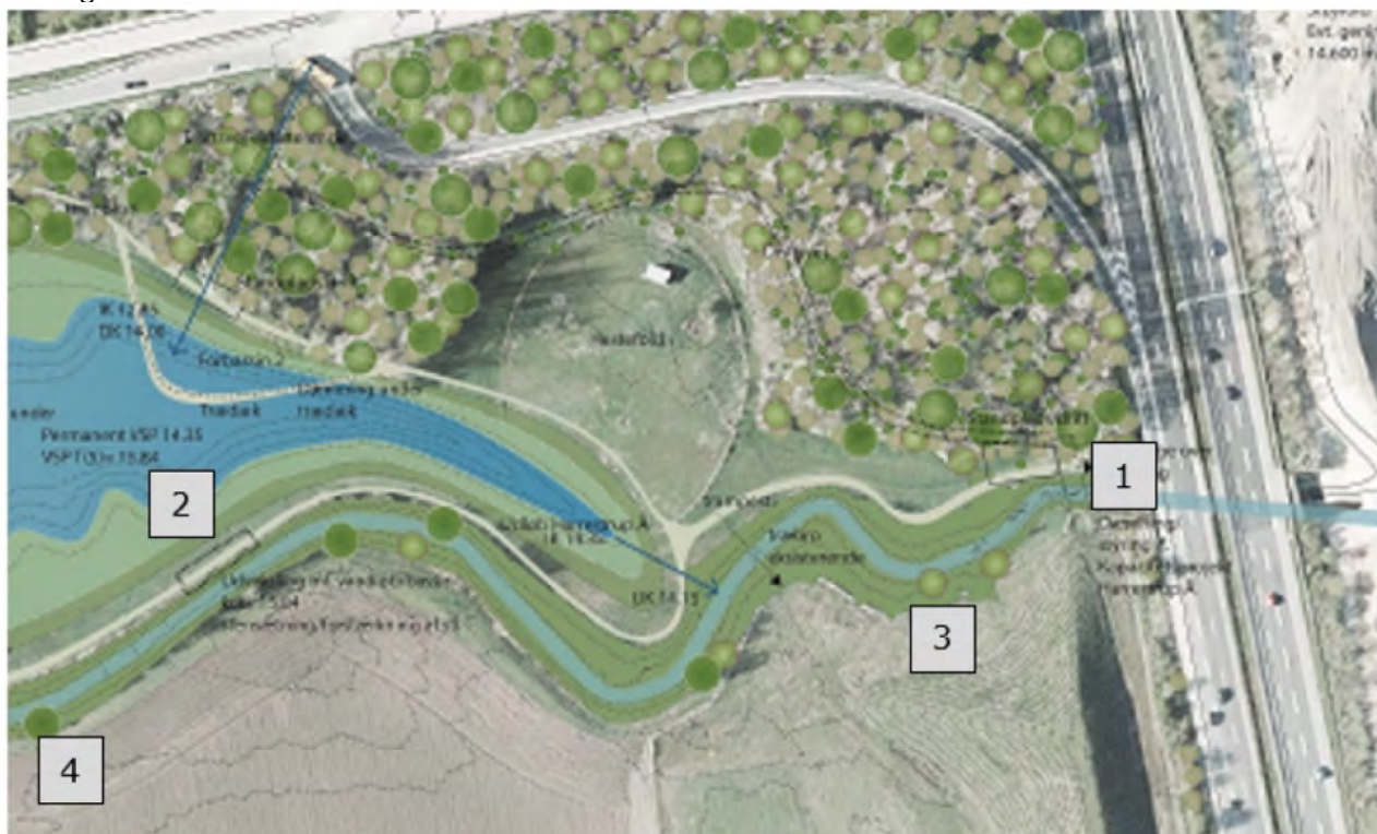
Figur 4. Fire del-elementer i projektet: 1. Etablering af sluse, 2. stabilisering af brink, 3. etablering af dobbeltprofil og 4. etablering af midlertidig kørebros.

I projektet er der fire elementer, der hver kræver tilladelse efter vandløbsloven (VL) og Bekendtgørelse om regulering og restaurering (reg.bek): 1. Etablering af sluse, 2. stabilisering af brink, 3. etablering af dobbeltprofil og 4. etablering af midlertidig kørebros.