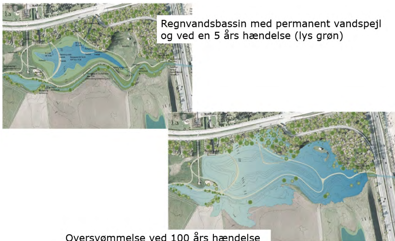
Figur 3. Tv. Regnvandsbassin med permanent vandspejl og vandspejl ved en fem års hændelse. Th. vandspejl ved en 100 års hændelse