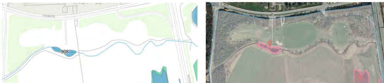
Figur 5. Tv Beskyttede naturtyper (NBL §3). Th registrerede beskyttede arter (Habitatdirektivets bilag IV)

I medfør af naturbeskyttelseslovens § 65, stk. 2 kan Kommunalbestyrelsen i særlige tilfælde dispensere for beskyttelsen efter en interesseafvejning imellem på den ene side hensynet bag beskyttelsen og på den anden side formålet med den ønskede ændring.