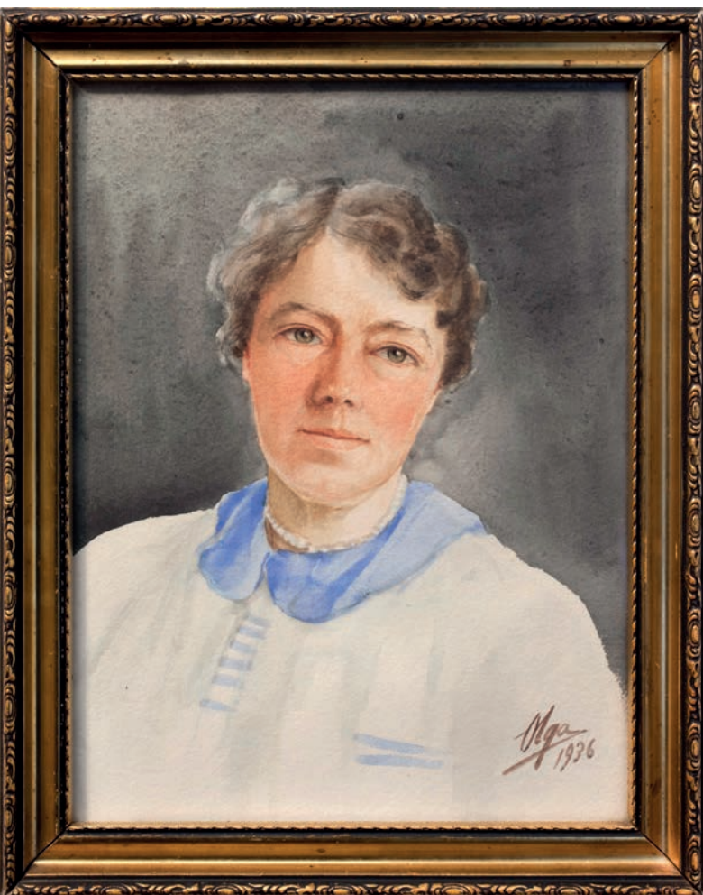
Selvportræt fra 1936. Akvarellen er indrammet i den såkaldte Ballerup ramme .