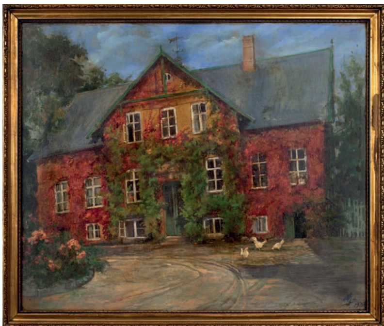
Stuehuset på Knudsminde, malet af Olga i 1938

Olga malede gennem hele livet, særligt motiver med blomster. Gennem sit liv skabte hun omkring 2000 malerier. De fleste er mellemstore akvareller, men hun malede også enkelte oliemalerier. Evnen til at male hjalp hende igennem livet - også når det var svært. Selvom Olga ikke var levebrødskunstner, så udstillede og solgte hun sine værker, der alle havde en traditionel og naturalistisk udtryksform.