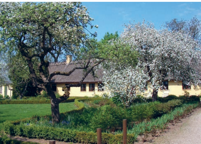
Lindbjerggård, Ballerup Museum i Pederstrup.

Ballerup Historiske Forening fejrede jubilæet den 24. april med en sammenkomst i Pederstrup for foreningens medlemmer. Foreningen har desuden udgivet en jubilæumsudgave af Byhornet . Endelig har foreningen i anledning af jubilæet lagt de 49 første årgange af bladet på foreningens hjemmeside balleruphistoriskeforening.dk