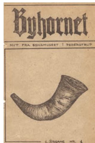
Det første nummer af Byhornet .

Ballerup Historiske Forening blev stiftet i 1936. Foreningen tog initiativ til oprettelsen af et egnsmuseum, som den i en lang årrække drev ved hjælp af frivillig arbejdskraft. I mange år udsendte foreningen hvert år et årshæfte.