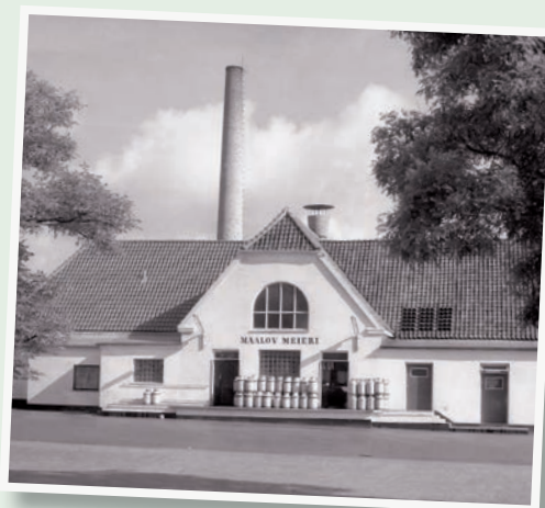
Måløv Mejeri, 1964. Byerne i Ballerupområdet forsynede københavnere med mælk, og derfor var der mange mejerier i området. Man sagde, at Ballerup lå på mælkevejen. I 1973 købte Ballerup Kommune Måløv Mejeri. Efter en større ombygning flyttede biblioteket ind i bygningen. Det nye bibliotek blev indviet den 1. oktober 1974.