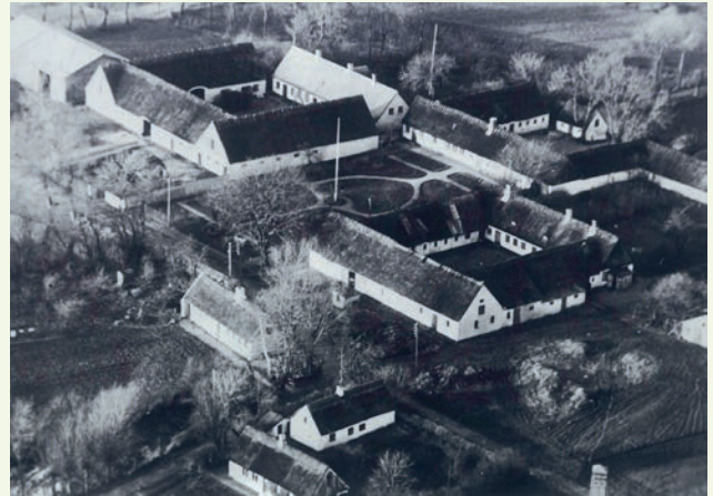
Til venstre: Konservatoren arbejder. Øverst: Luftfoto af Pederstrup 1939. Nederst: Detalje fra køkken.