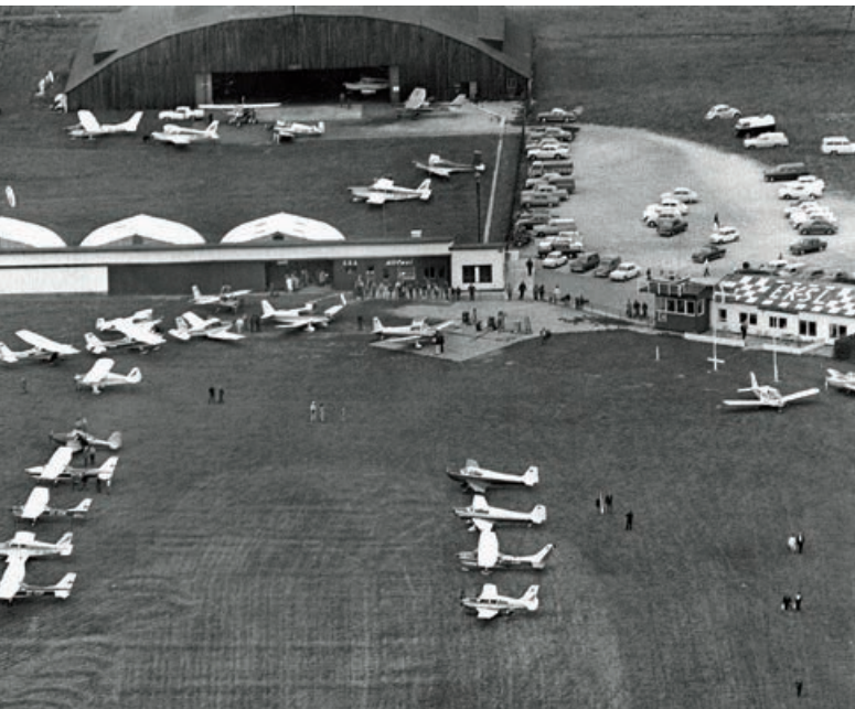
Foto på forrige side: Skovlunde Flyveplads, foto: Kastrup Luftfoto Herover: Luftfoto af Skovlunde Flyveplads. Til højre: Speedwaykører Morian Hansen, der grundlagde Skovlunde Flyveplads.