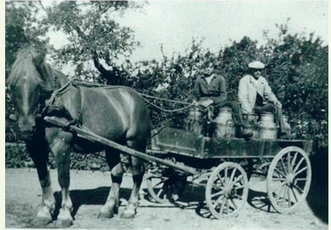
Hestevogn med mælkejunger i Pederstrup engang i 1940'erne - omkring den tid hvor der kom el til landsbyen.

I 1953 kom Junior Mixeren på markedet. Den var en langt mindre køkkenmaskine, der var hen-