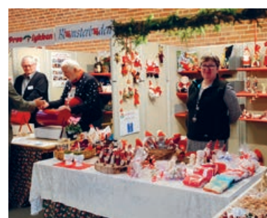
Foto fra en tidligere julebazar