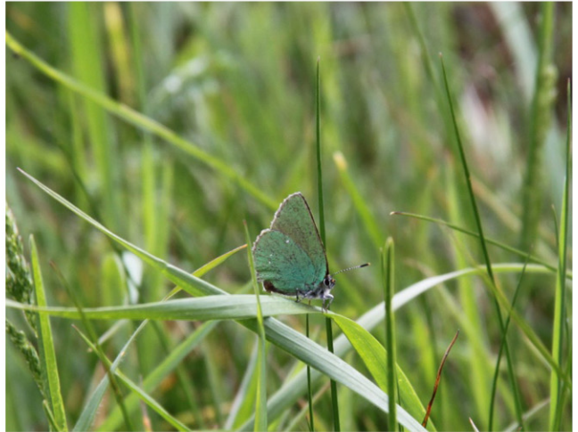
Eksempler på faunainteraktioner. Øverst tv. almindelig knopurt ( Centaurea jacea ) med citronsommerfugl ( Gonepteryx rhamni ), øverst th. pil ( Salix sp.) med dagpåfugleøjje ( Aglais io ), midten tv. slåen ( Prunus spinosa ) med dagpåfugleøjje, midten th. agertidsel ( Cirsium arvense ) med det hvide w ( Satyrium w-album ), nederst tv. alm. røllike ( Achillea millefolium ) med dukatsommerfugl ( Lycaena virgaureae ) og nederst th. grøn busksommerfugl ( Callophrys rubi ) på græs.