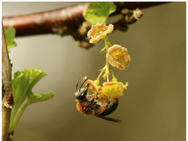
Øverst tv. musevikke ( Vicia cracca ) med fempletet køllesværmer ( Zygaena lonicerae ), øverst th. eng-brandbæger ( Jacobaea vulgaris ), midten tv. græsråndøje ( Maniola jurtina ) på græs, midten th. blåmunke ( Jasione montana ) med mørk jordhumle ( Bombus terrestris ), nederst tv. bugtet kløver ( Trifolium medium ) med markperlemorsommerfugl ( Speyeria aglaja ) og nederst th. solbær ( Ribes nigrum ) med rødhalet jordbi ( Andrena haemorrhoa ).