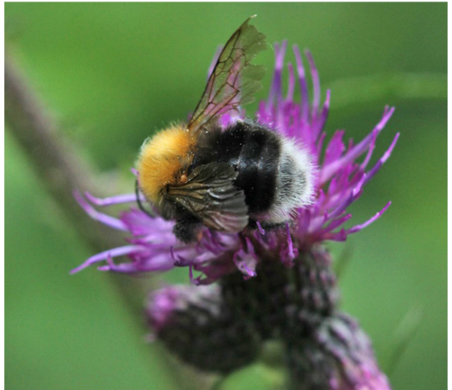
Øverst tv. alm. katost ( Malva sylvestris ) med stor saksebi ( Chelostoma rapunculi ), øverst th. vild gulerod ( Daucus carota ) er populær hos mange insekter, midten tv. almindelig knopurt ( Centaurea jacea ) med tidselsommerfugl ( Vanessa cardui ), midten th. stor knopurt med citronsommerfugl ( Gonepteryx rhamni ) og tidselsommerfugl, nederst tv. vindrossel ( Turdus iliacus ) spiser tjørnebær og nederst th. kærtidse ( Cirsium palustre ) med hushumle ( Bombus hypnorum ).