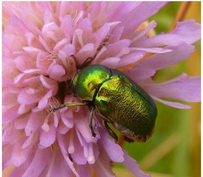
Blåhat ( Knautia arvensis ) indgår i mange faunainteraktioner. Her seks eksempler. Øverst tv. blåhatblomstertæge ( Placochilus seladonicus ), øverst th. blåhatjordbi ( Andrena hattorfiana ), midten tv. blåhat-langhornsmøl ( Nemophora metallica ), midten th. agerhumle ( Bombus pascuorum ) og blåhatjordbi (flyvende), nederst tv. klitperlemorsommerfugl ( Fabriciana niobe ) og nederst th. en faldbille (sandsynligvis Cryptocephalus aureolus ).