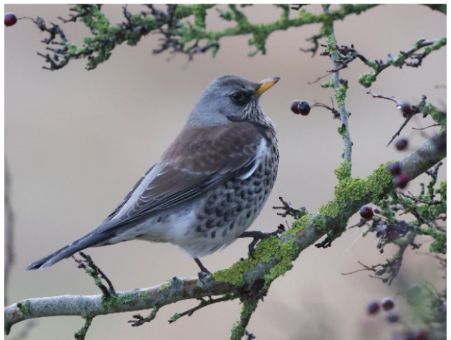
Øverst tv. Mark-rødtop ( Odontites vernus ) med mørk jordhumle ( Bombus terrestris ), øverst th. smalbladet høgeurt ( Hieracium umbellatum ) med storpletet perlemorsommerfugl ( Issoria lathonia ), midten tv. vedbend ( Hedera helix ) med masser af admiraler ( Vanessa atalanta ), midten th. almindelig knopurt ( Centaurea jacea ) med rød blomsterbuk ( Stictoleptura rubra ), nederst tv. solbær ( Rubus nigrum ) med rødpelet jordbi ( Andrena fulva ) og nederst th. sjagger ( Turdus pilaris ), der spiser bær på tjørn.