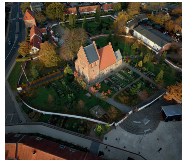
Ballerup Kirke. Det gamle Ballerup – en bygning som i kraft af sin høje materialemæssige kvalitet og sin betydning for byen har holdt i foreløbig ca. 800 år.