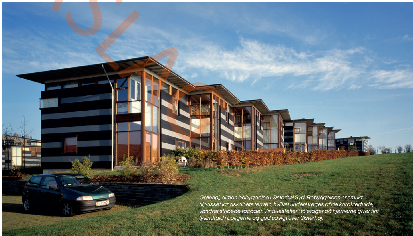
Grønhøj, almen bebyggelse i Østerhøj Syd. Bebyggelsen er smukt tilpasset landskabets terræn, hvilket understreges af de karakterfulde, vandret stribede facader. Vinduesfelter i to etager på hjørnerne giver fint lysindfald i boligene og god udsigt over Østerhøj.

Det er vigtigt at bemærke, at kommunernes mulighed for at stille krav skal balanceres med økonomien i renoveringsprojekterne, og fastsættelsen af arkitektoniske krav sker ofte i en dialog mellem kommune, boligorganisation og Landsbyggefonden.