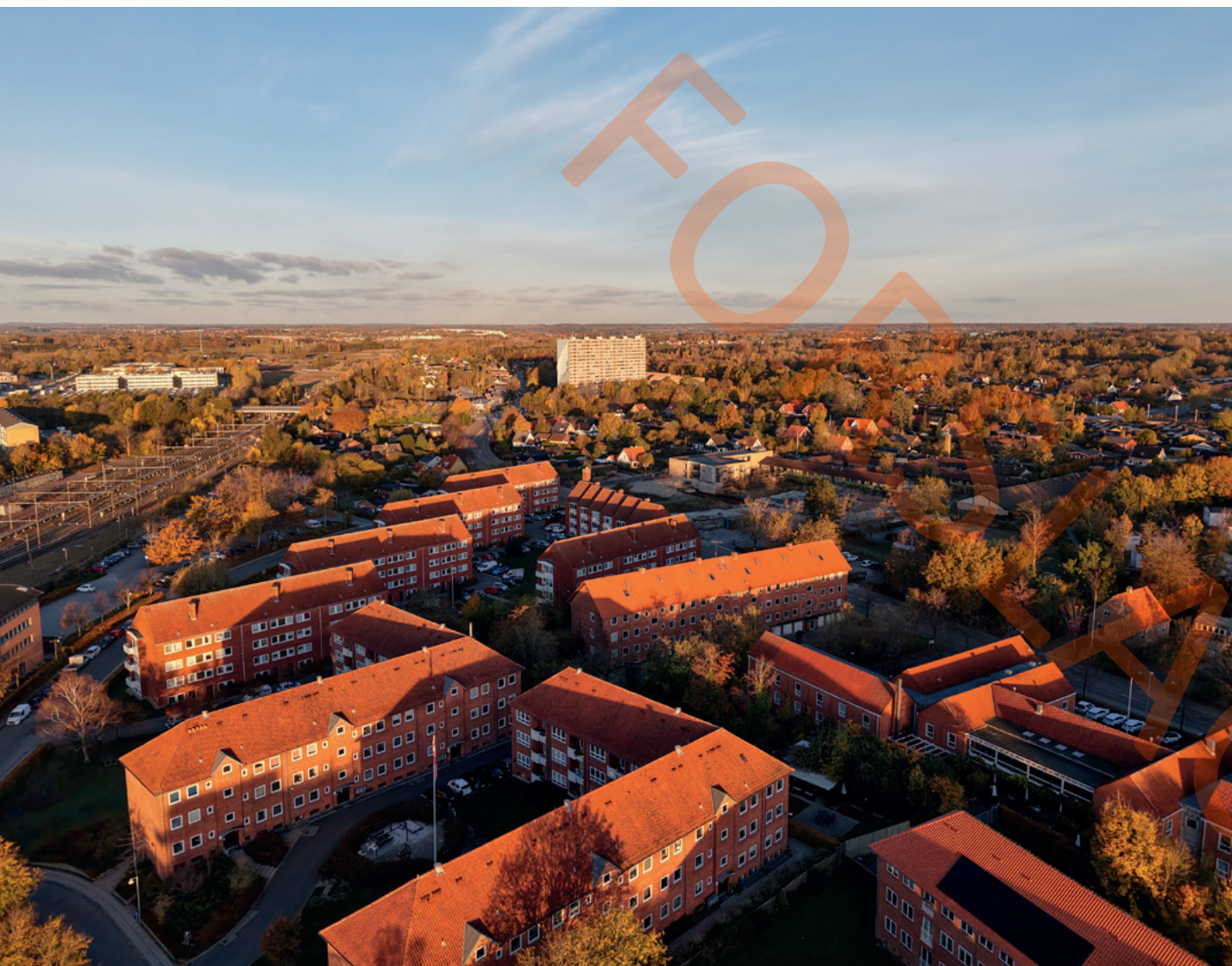
Ballerup i morgenlys – i forgrunden det fine tidstypiske og gedigne boligområde ved Lindevænget, med S-banen til venstre og Bispevangens højhus i baggrunden. Bebyggelser fra den store udbygning af kommunen i 1960'erne og 70'erne.