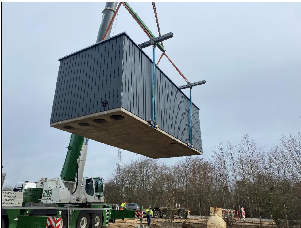
Figur 2. Færdigbygget booster station afsættes direkte fra kran.