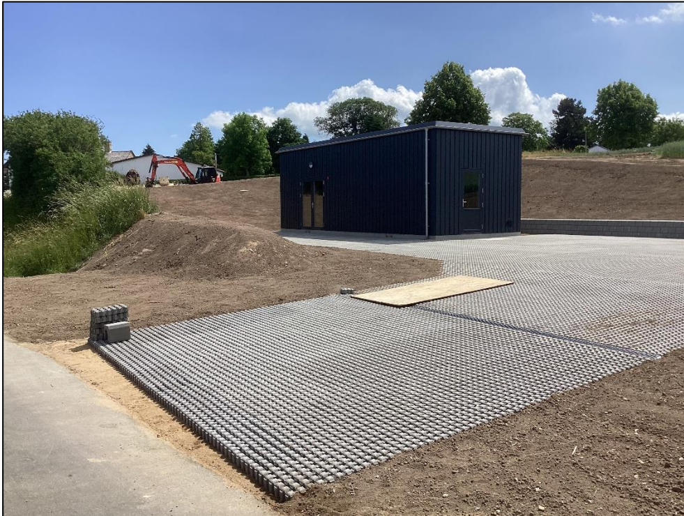
Figur 1. Princip for etablering af booster station.