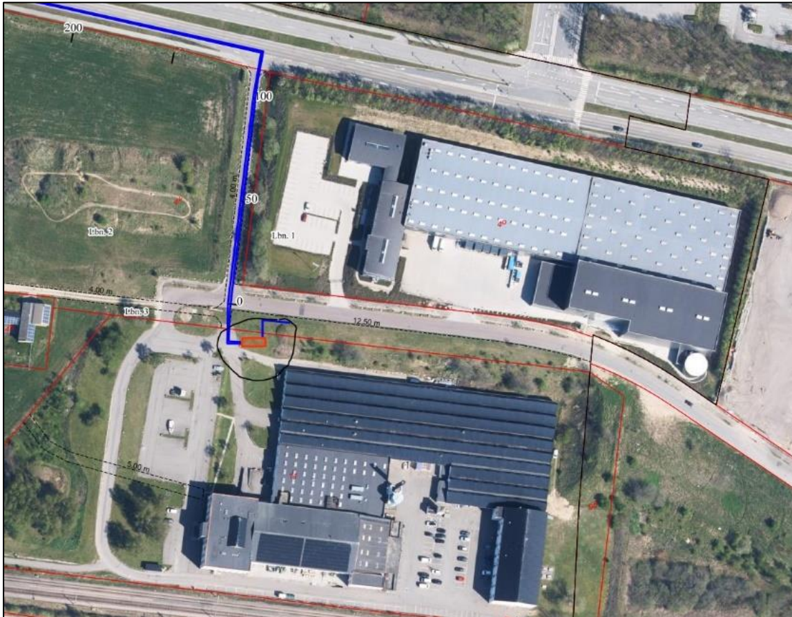
Figur 3. Udsnit af placering af booster station i Måløv Teknikerby.

Booster stationen skal placeres på matrikelnummer 11 Sørup By, Måløv med indkørsel fra Måløv Byvej i Ballerup kommune, som vist på Figur 3.