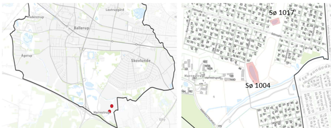
Fig. 1 Placering af sø 1004 og 1017

Matrikel 5 t og 6 c er ejet af Omegnens Fritidshaveforening Harrestrup.