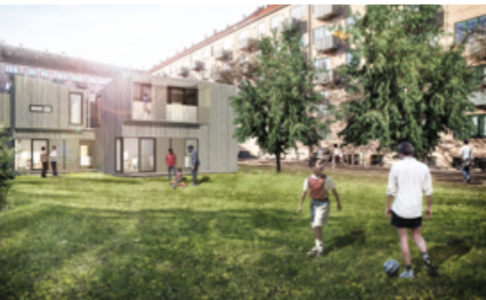
Venligbolig opsat i gårdrum – i tættere byområde.

Venligbolig er et non-profit initiativ, der giver danskerne mulighed for at invitere flygtninge til at bo midlertidigt i et moderne anneks på deres egen grund. Venligbolig bygger på en unik dansk tradition for god arkitektur med social omtanke, hvor bolig og integration er tænkt sammen som en helhed.