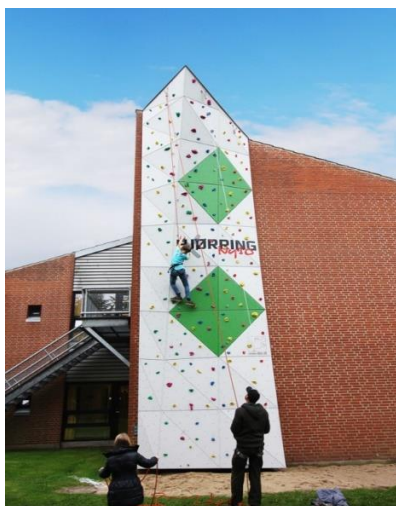
Eksempel på udendørs væg.

Området mellem træerne for enden af hallen giver mulighed for opførelse af en udendørs klatrevæg på op til 20m i bredden og ca. 15 meter i højden. Se eksempel fra anden udendørs væg fra Hjørring (dog en mindre væg end vi påtænker)