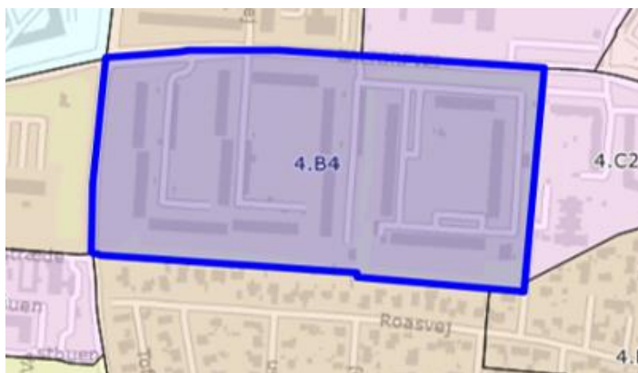
Rammeområder, Kommuneplan 2013-2025

Imidlertid er det ikke sikkert, at den nye kommuneplan når at blive vedtaget, inden den nye elokalplan nr. 188, som skal muliggøre opførelsen af den nye bebyggelse, skal vedtages endeligt. Det er baggrunden for udarbejdelsen af dette kommuneplantillæg nr. 15, som udsendes i høring sammen med lokalplanforslaget. Det indeholder de samme ændringer af rammebestemmelserne for Ellebo, samt den samme opdeling af det nuværende rammeområde, som den kommende Kommuneplan 2019-31 kommer til at indeholde, nemlig en opdeling i enkeltområde 4.B4 og 4.B17.