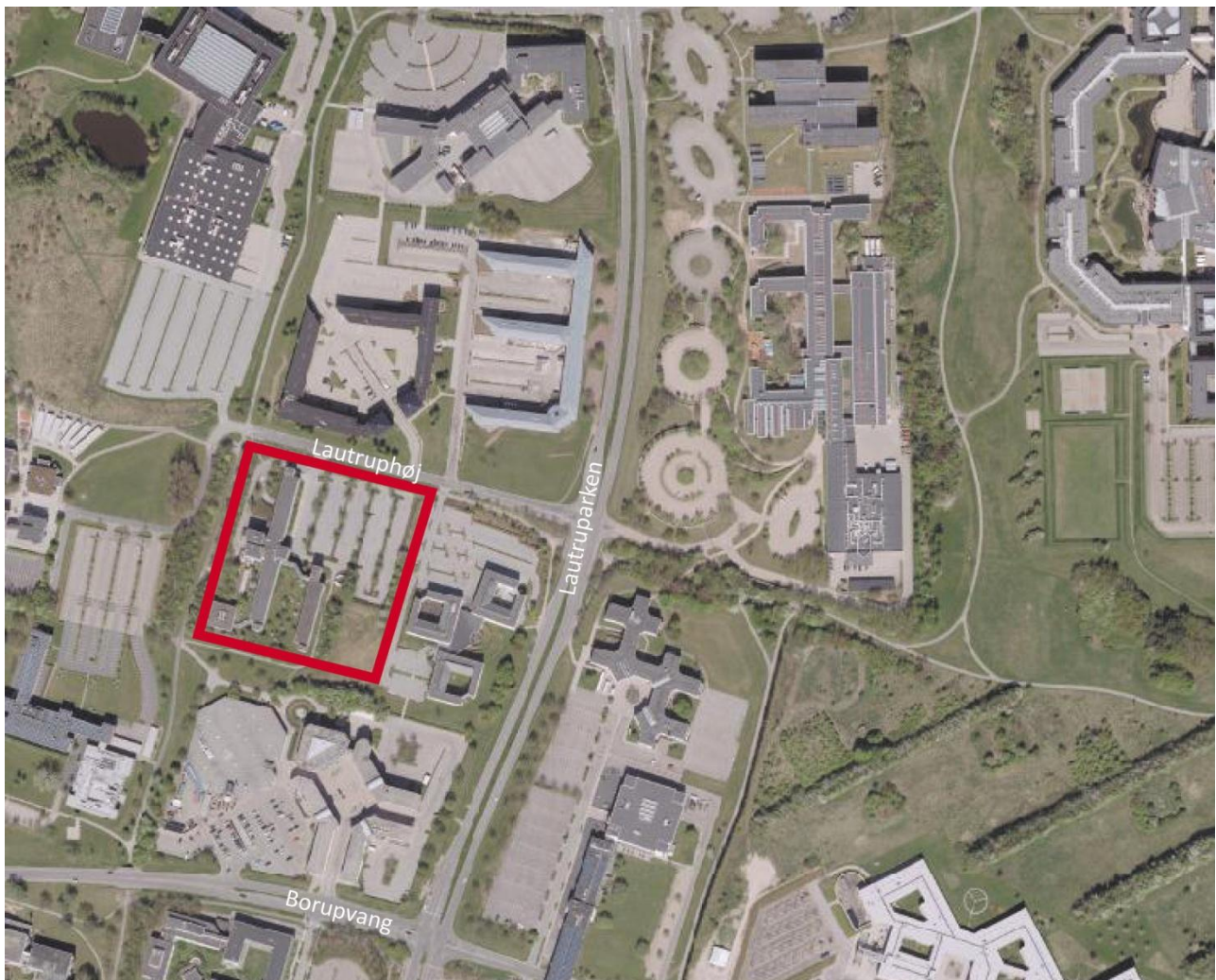
Forslag til lokalplan 195. Lokalplanafgrænsning

Forslag til Kommuneplan 2019 er efter politisk behandling sendt i offentlig høring med henblik på endelig vedtagelse i foråret 2019. Derfor udarbejdes der i forbindelse med det aktuelle lokalplanforslag et tillæg til den hidtidige Kommuneplan 2013. Det skal sikre, at lokalplanen er i overensstemmelse med kommuneplanlægningen, selvom Kommuneplan 2019 ikke vil være endeligt vedtaget ved lokalplanforslagets offentliggørelse.