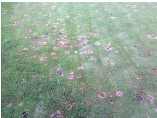
Billede af green 18 taget i januar 2019