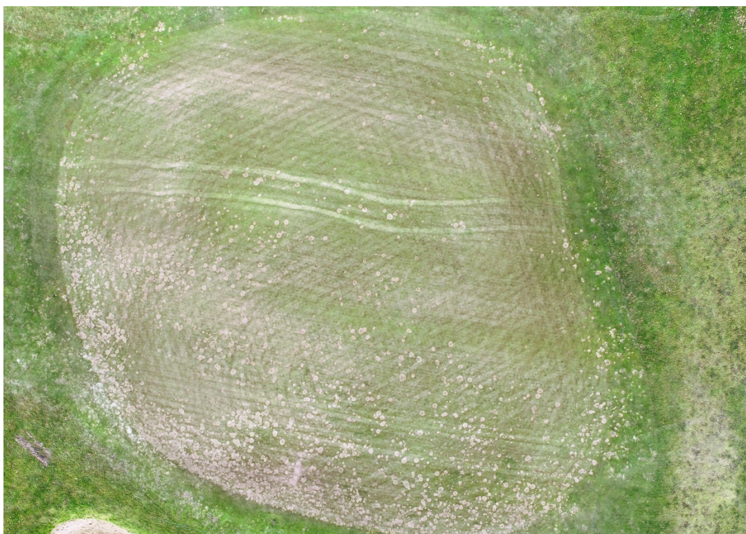
Dronebillede af hele green 18 taget i februar 2019.

(Som det fremgår er "græsset" uegnet til brug for golf.)