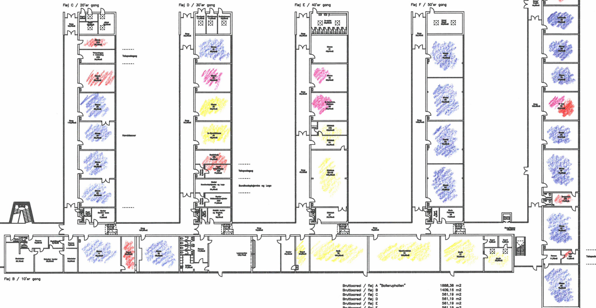
Fløj B / 10'er gang