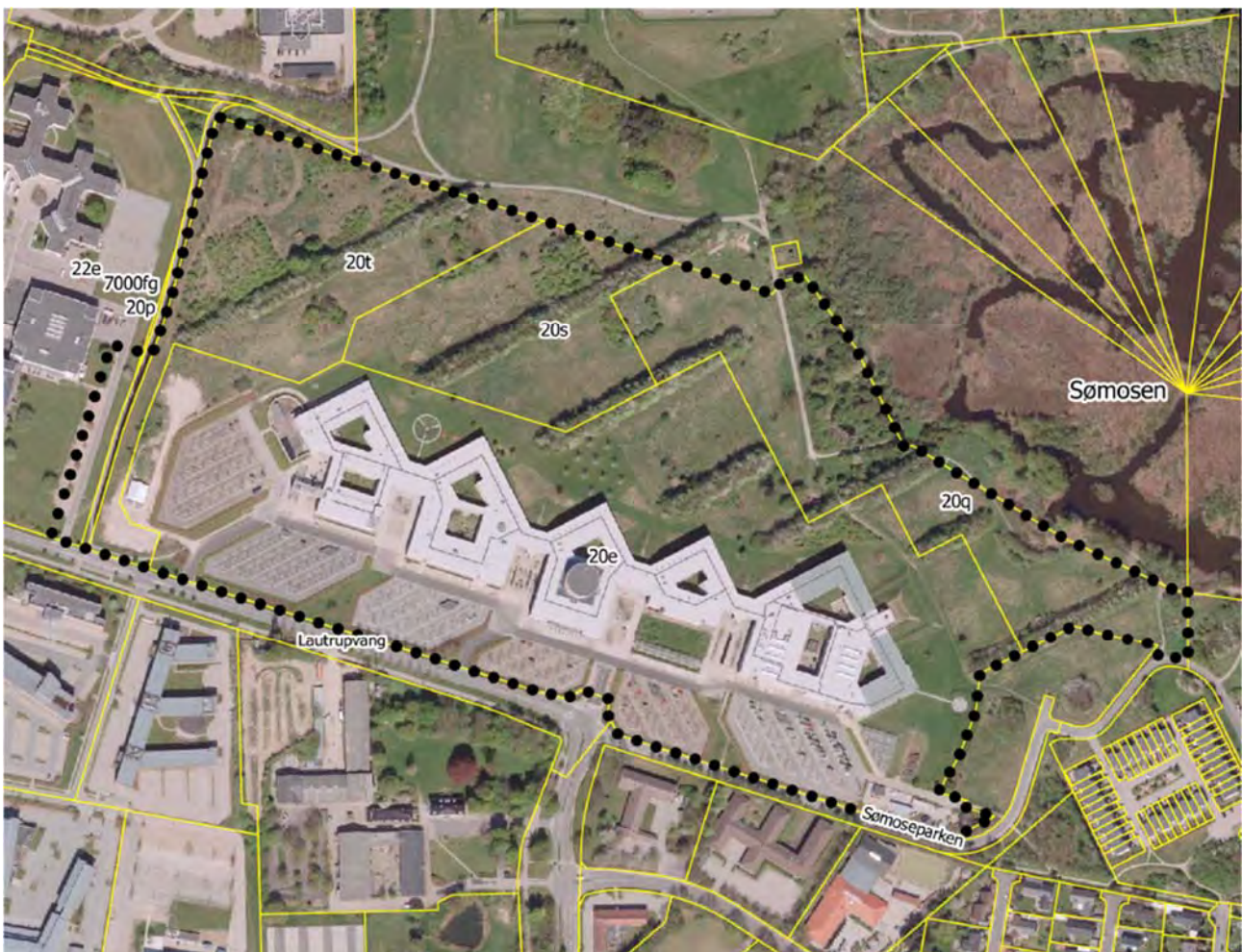
Fig. 1: Forslag til lokalplan 175 - lokalplanafgrænsning

Kommuneplantillægget er udarbejdet i tilknytning til Kommunalbestyrelsens behandling af et forslag til Lokalplan nr. 175 for campusområde ved DTU i Ballerup. Lokalplanens afgrænsning er vist på fig. 1. Da den fremtidige anvendelse af dele af området til boligformål ikke er mulig inden for den gældende kommuneplans rammebestemmelser, skal der udarbejdes et kommuneplantillæg.