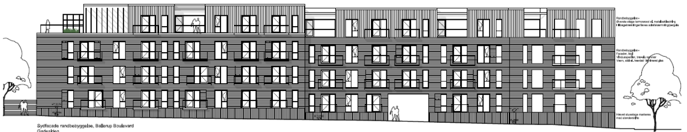
Sydfacade randbebyggelse, Ballerup Boulevard Gadeskjen