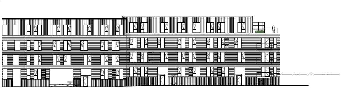
Norrfacade randbebyggelse, Ballerup Boulevard Indgangsalden

Revideret facade mod boulevarden (øverst) med port og tagaltaner, og ind mod bebyggelsens fællesområde (nederst); facaden mod Torvevej bliver tilsvarende og rummer også en port.