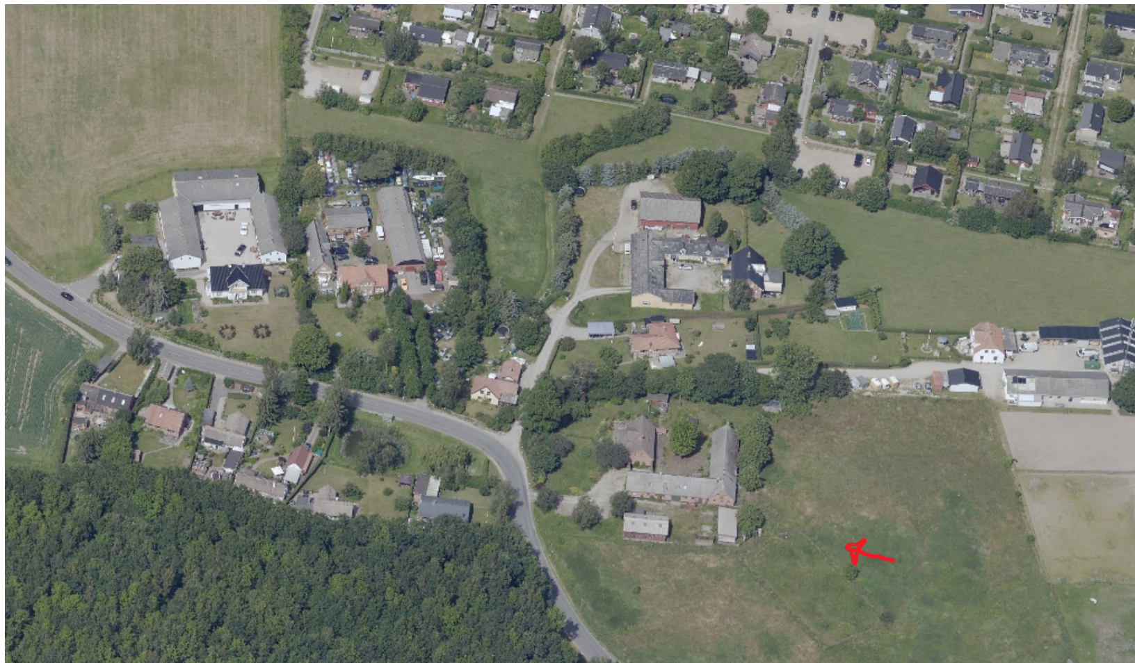
Rød pil peger mod Ravnstrupgård