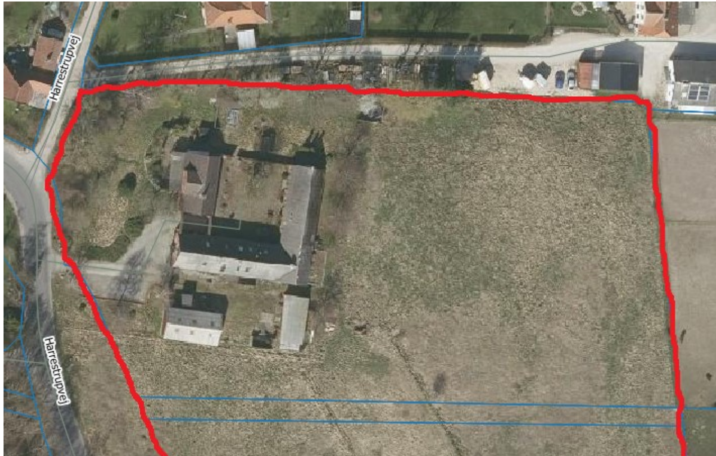
Ejendommen set fra luften