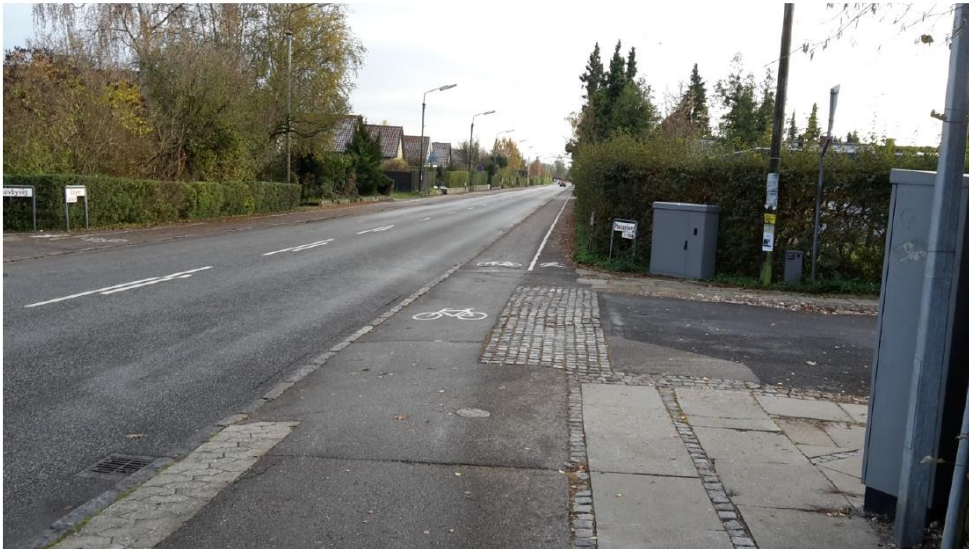
Figur 3: Ejbyvej ved Hasselvej set mod syd med overgang fra cykelsti/fortov til delte stier

Det forslås at de delte stier mellem Hasselvej og Åbyvej bygges om til separat cykelsti og fortov. Desuden skal hastigheden sænkes, da den sydlige del af Ejbyvej også skal være en del af 40 km/t-zonen. Ud fra oversigtsforholdene fra sidevejene anbefales det desuden, at beskære beplantningen og evt. håndhæve hjørneafskæringer. Løsningen skaber mere tryghed for fodgængere og bedre oversigt til cyklister ved udkørsel fra sideveje og indkørsler.