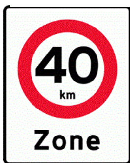
Figur 2: Tavle for 40 km/t zone

Formålet ved at etablere indsnævringerne er at sænke hastigheden, og dermed at øge trygheden og trafikikkerheden for borgerne og skoleeleverne. Der vil være tale om en påbudt hastighedsgrænse så politiet har mulighed for at udstede bøder, hvis man kører over 40 km/t.