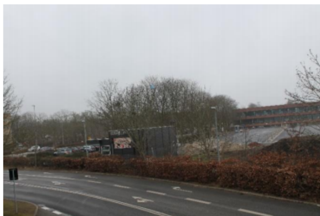
Udsigt fra P hus mod vest, Baltorpeplænen