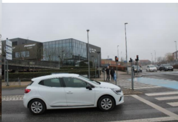
Udsigt fra kryds Baltorpevej mod øst

- En udendørscene som Teatergruppen Klima efterlyser, men som også kan bruges til optræden fra andre for eksempel lørdags jazz og lignende optrædende, der i kraft af sin