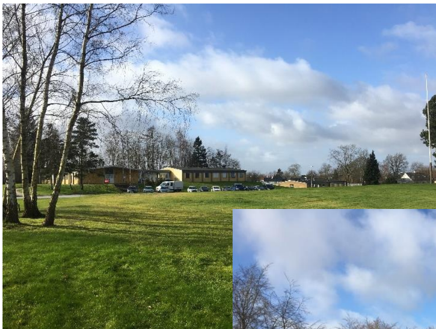
Administrations-bygningerne i den sydlige del af Jonstruplejren

Området er i dag lukket for offentligheden. Der er stadig hegn hele vejen rundt om området. Trafikalt betjenes området fra Jonstrupvej via en enkelt vej gennem en port. Det gælder også for gående og cyklende.