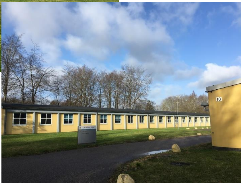
Barak-bebyggelsen op mod Jonstrup Vang