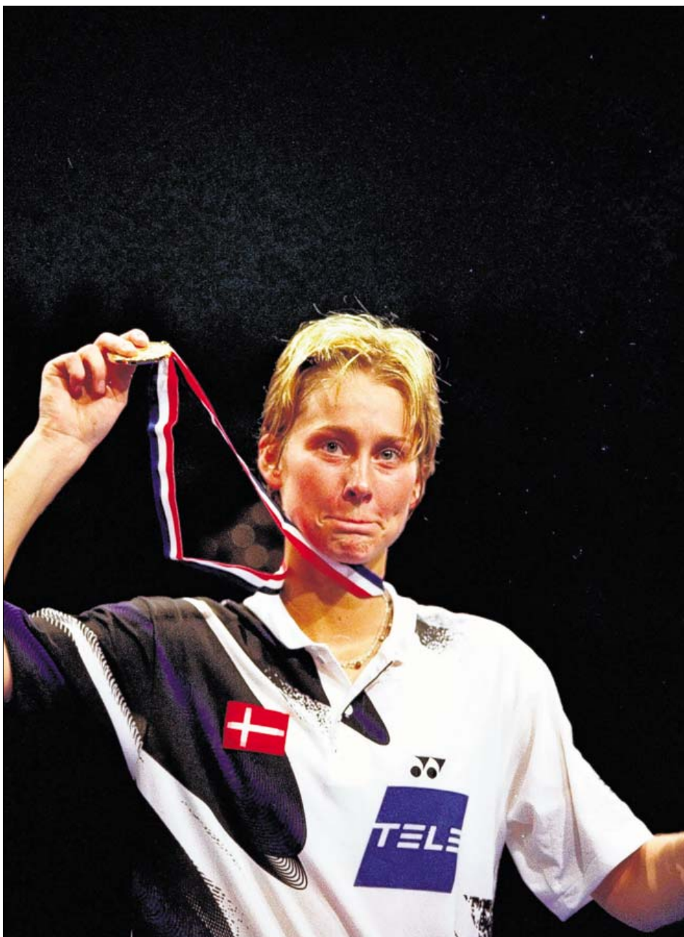
Camilla Martin vandt VM i Brøndbyhallen i 1999. Det var begyndelsen til et stort medlemsboom i badmintonforbundet, der håber at kunne gentage succesen ved det kommende VM i København.

Sidst et badminton-VM blev afholdt i Danmark løb en 25-årig blond aarhusianer med guldet i damernes single og startede en nationalt medlemsboom: Camilla Martin-