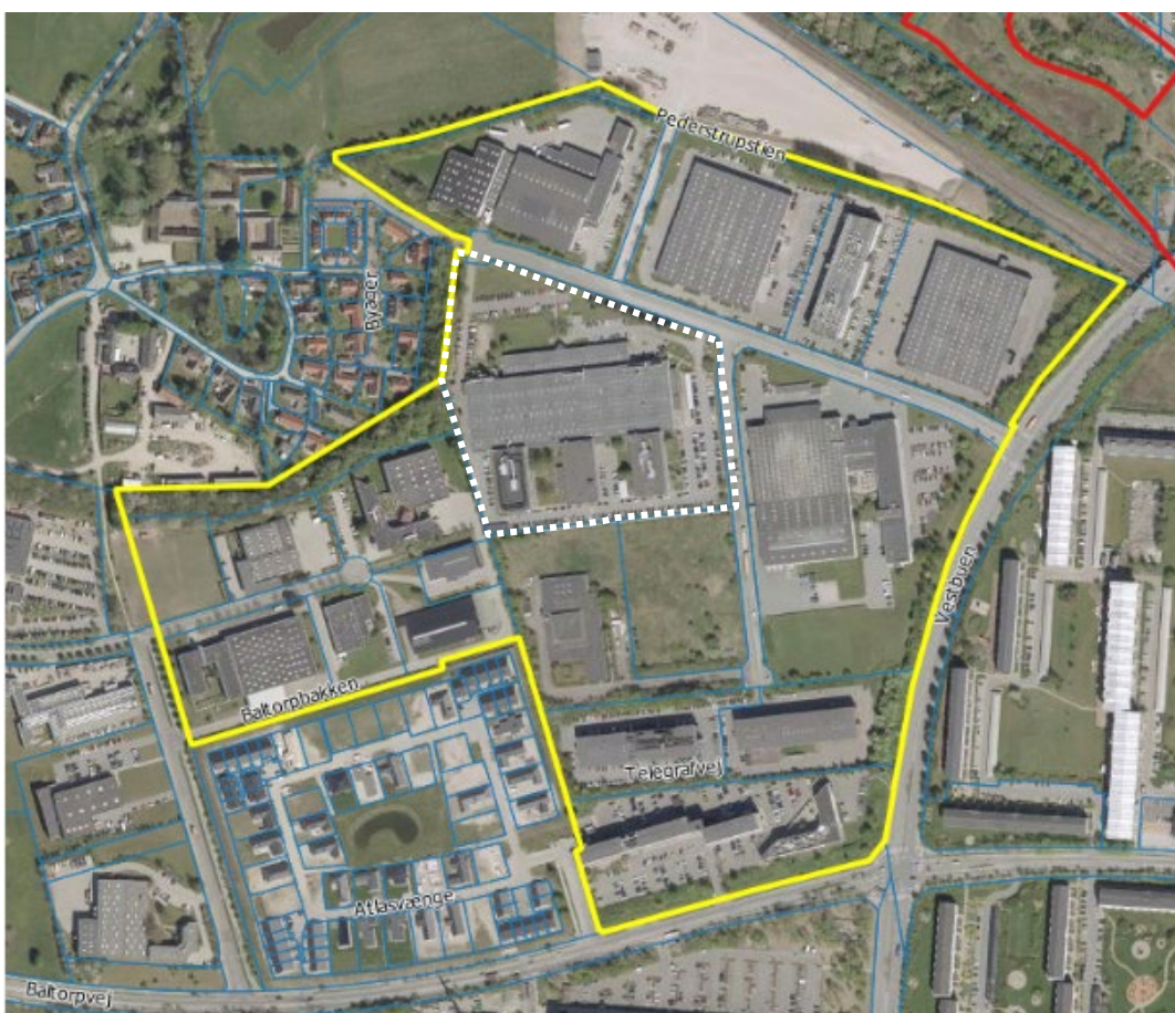
Figur 1. Den gule markering på kortet viser arealet, der indgik som projektområde i Helhedsplanen og som planlægges omdannet over tid. Det stiplede areal er TEC-grunden.

TEC-grunden på Telegrafvej 9 er i dag en uddannelsesinstitution, men TEC ønsker at flytte. Derfor er der tilvejebragt kommuneplantillæg, som muliggør at omdanne grunden til boligformål.