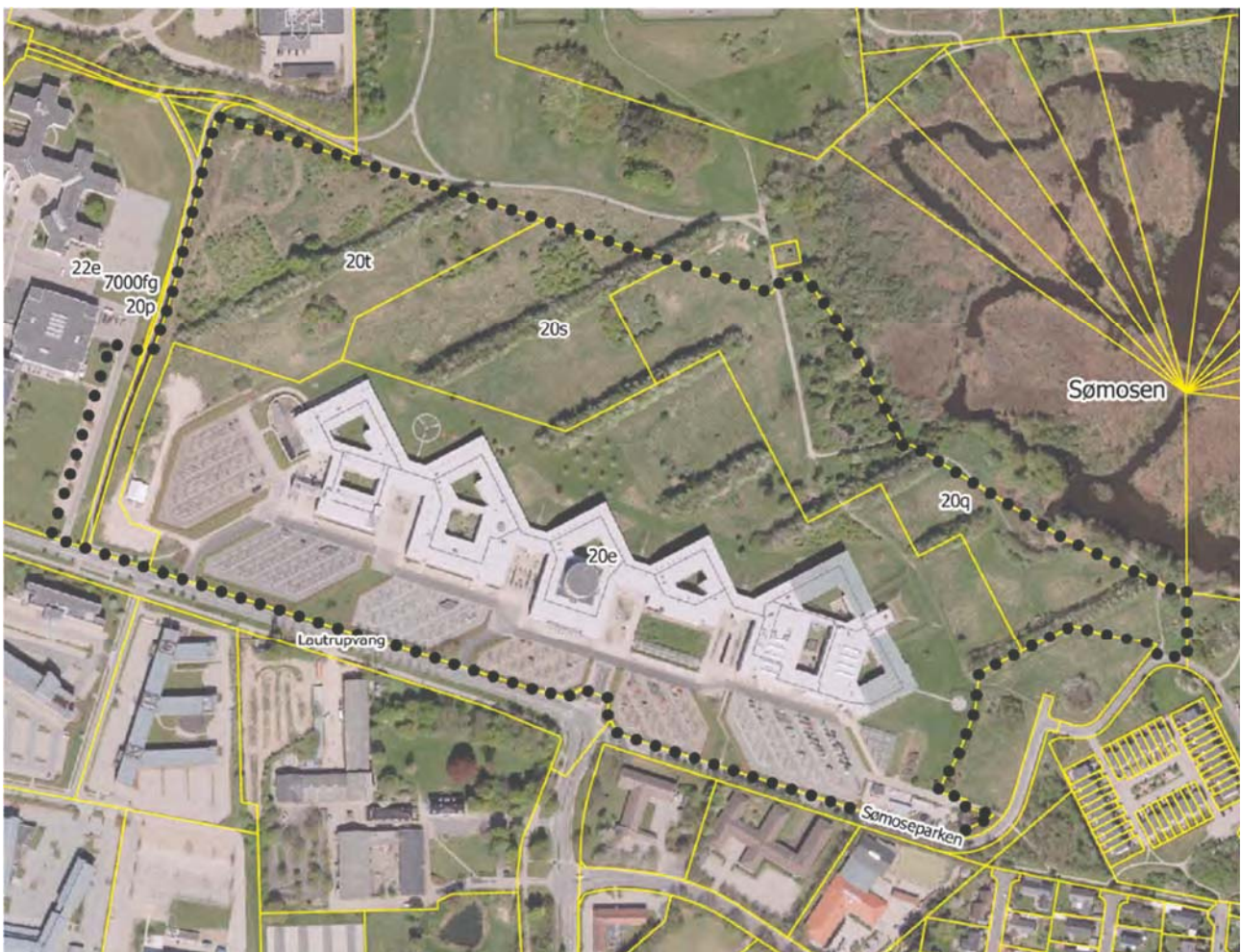
Fig. 1: Forslag til lokalplan 175 - lokalplanafgrænsning

Kommuneplantillægget er udarbejdet i tilknytning til Kommunalbestyrelsens behandling af et forslag til Lokalplan nr. 175 for campusområde ved DTU i Ballerup. Lokalplanens afgrænsning er vist på fig. 1. Da den fremtidige anvendelse af dele af området til boligformål ikke er mulig inden for den gældende kommuneplans rammebestemmelser, skal der udarbejdes et kommuneplantillæg.