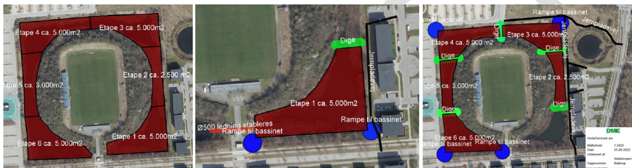
Figur 2. Oversigt over 6 oprensningsetaper th. I midten ses princip for oprensning af 1. etape og til højre de øvrige etaper. Illustrationer fra ansøgning om VVM. Udarbejdet af HedeDanmark

Oprensningen vil ske i flere etaper, hvor bassinet inddeles i sektioner, se figur 2. Hver sektion tørpumpes til bassinets øvrige våde sektioner. Vand, som tilløber bassinet under oprensningen, vil blive pumpet forbi den sektion, der oprensnes. Når tørstofindholdet i den tørlagte sektion løbet af få dage er blevet tilstrækkeligt højt, opgrabbes sedimentet, hvorefter det køres til kontrolleret afvanding/deponi. Herefter uddybes sektionen til den ønskede dybde på 1,5 meter.