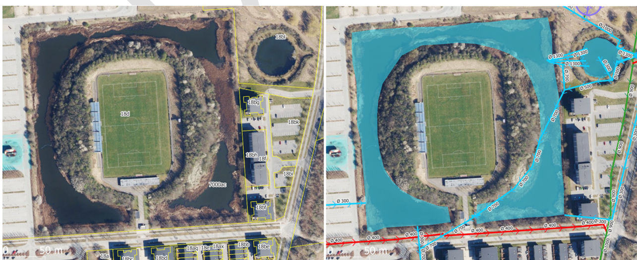
Figur 1. Luftfoto 2022. Stadionsøen. Til venstre med markering af matrikler. Til højre beskyttet natur (blå flade) og regnvandsledninger (blå linjer).

Forsyningsvirksomheden Novafos A/S har ansøgt om dispensation til oprensning af rørskov i samt uddybning af Stadionsøen. Uddybningen angår 1,5 meter på det dybeste sted.