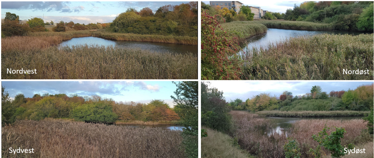
Figur 3. Fotos af Stadionsøen set fra de fire verdenshjørner. Der ses tilgroning med rørsump. Taget den 11. oktober 2021

Der er ikke fundet beskyttede padder i Stadionbassinet. Nærmeste fund er i Pottemagersøen ca. 200 meter mod sydøst, se figur 4. Pottemagersøen er en god paddelokalitet, hvor der udover spidssnudet frø yngler butsnudet frø, skrubtudse og lille vandsalamander. Spidssnudet frø er opført på Habitatdirektivets bilag IV.