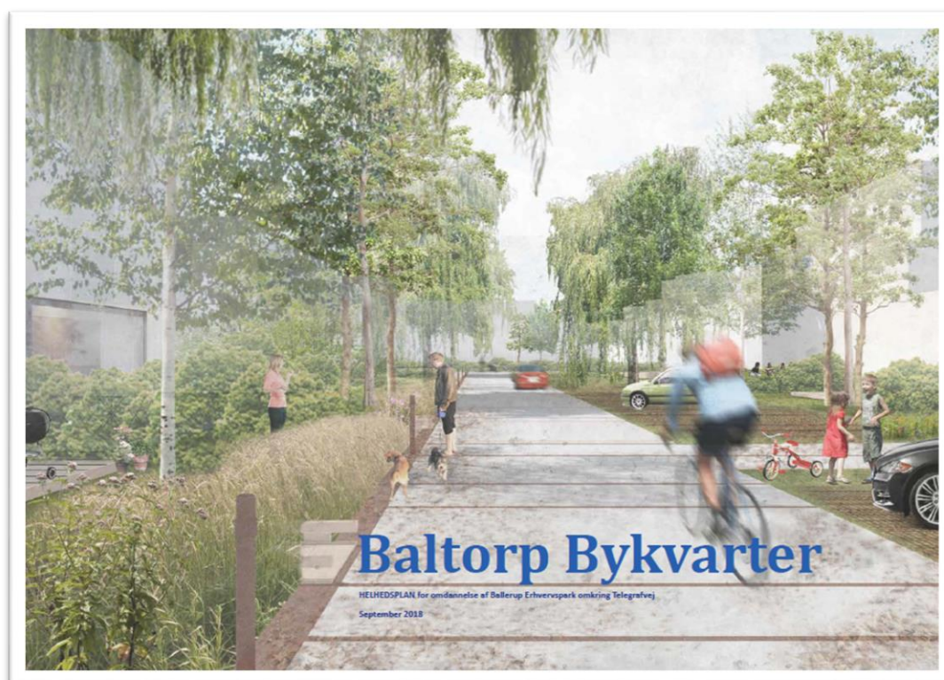
Figur 1. Helhedsplanen for områdefornyelsen.

I efteråret 2019 indkaldte Ballerup Kommune idéer og forslag til den videre planlægning, jf. Planlovens § 23 c. I samme forbindelse blev en helhedsplan for byomdannelsesområdet præsenteret.