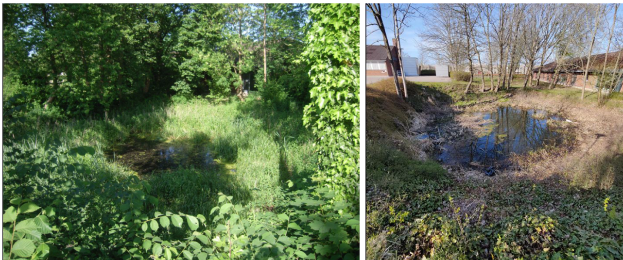
Figur 2. Fotos fra hhv. besigtigelse den 1. juni 2018 (tv) og 19. april 2022 (th)

Den 19. april 2022 blev søen besigtiget, og her blev søen ligeledes vurderet til at have en ringe naturtilstand (se bilag). Søen er stadig næringspåvirket, overskygget af træer og vandet er grumset. Søen har en stejl afgrænsning mod de befæstede arealer på matriklen. Ved besigtigelsen blev der observeret to voksenindivider af lille vandsalamander, en af dem i parringsdragt. Der blev ikke observeret beskyttede arter (habitatdirektivets bilag IV). Øvrige fund: posthornssnegl, rygsvømmer og skøjteløber. Af planter fandtes lodden dueurt, høj sødgræs, kors-andemad, bredbladet dunhammer, dusk-fredløs, vorterod, febernellikero, slimtråd (grøn-alge), dynd padderok og gul iris.