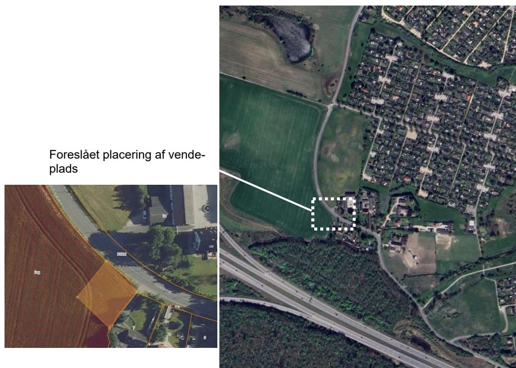
Foreslået placering af vendeplads

Forslaget kan besluttes uafhængigt af fastholdelsen af basisforslaget i Nyt Ringnet. Fristen for en beslutning der kan videregives til Movia, er ved den ordinære trafikbestilling slut oktober 2024.