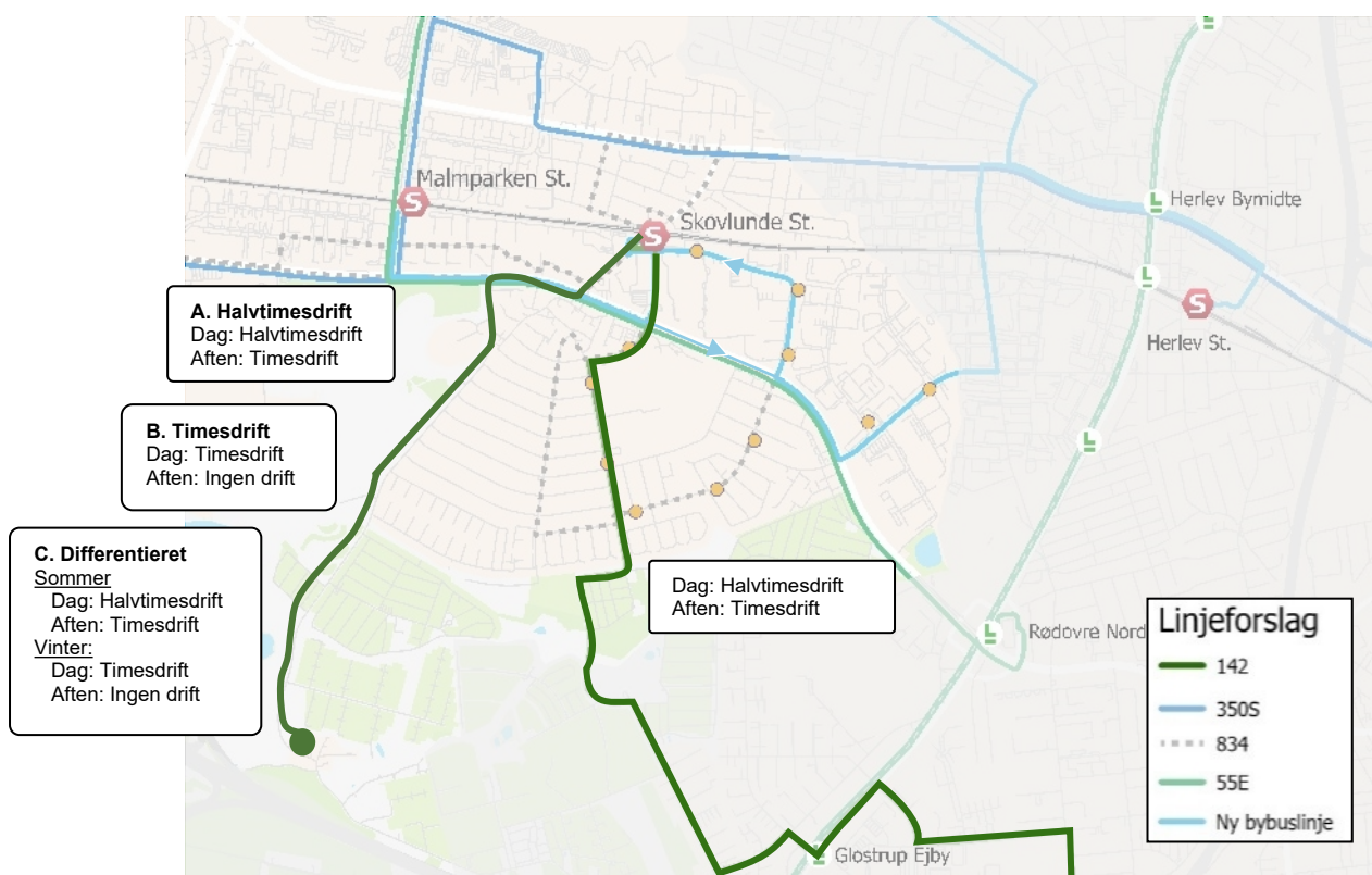
Figur 2 Forslag 2 - Linje 142 forlænges fra Skovlunde St. til Harrestrupvej

Ballerup Kommune kan vælge at forlænge nogle eller alle afgangene på linje 142. Hvis alle afgangene fortsætter ad Harrestrupvej, vil der være halvtimesdrift på Harrestrupvej i dagtimerne og timesdrift om aftenen alle ugens dage.