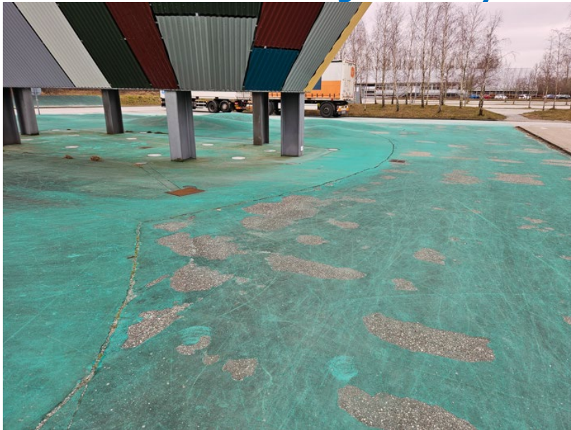
Figur 1: slidt belægning under skulpturen