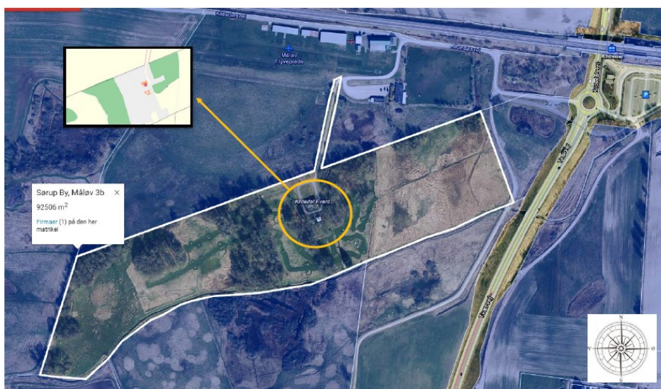
Figur 2: Luffoto af matrikel

Der forefindes to bygninger på ejendommen vist inden for den orange cirkel nedenfor.