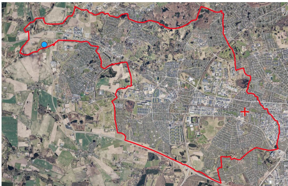
Figur 1: Oversigtskort

Nedenfor redegøres for de afledte driftsudgifter samt anlægsudgifter som følge af et køb fra HOFOR af 'KILDEDAL' - Matrikel nr. 3b, Sørup By, Måløv.