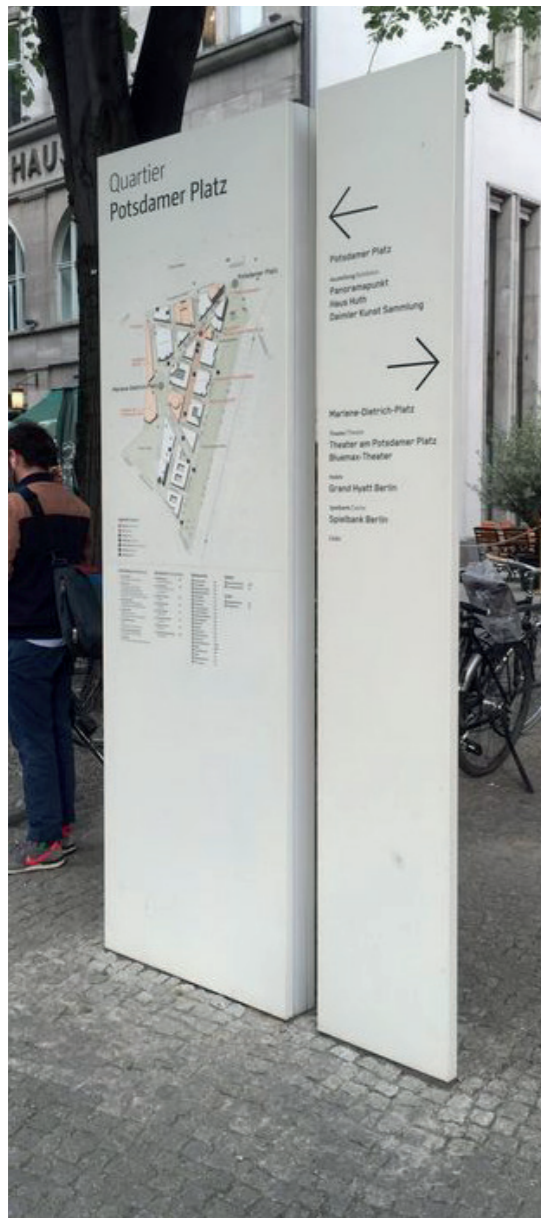
Eksempel på infotavle

Indgange samt ind- og udkørsler skal markeres tydeligt. Skiltningen skal endvidere suppleres med informationstavler omkring ledig kapacitet o.l.