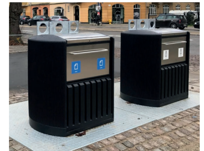
VF600. Nedgravet affaldscontainer.

I bygader og lokalgader placeres containerne i gadernes flexzoner. I de enkelte byområder placeres containerne efter behov.