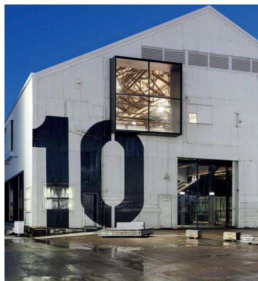
Eksempler på skiltning med store bogstaver og tal integreret i facadeudtryk