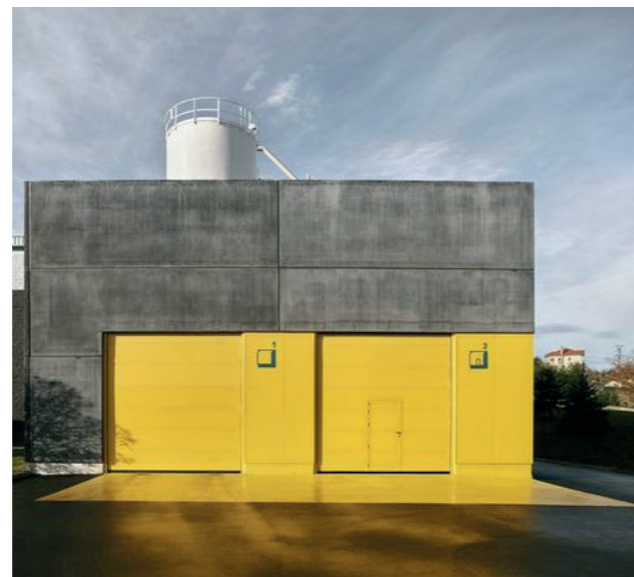
Eksempel på markering af indgang med særlig farve