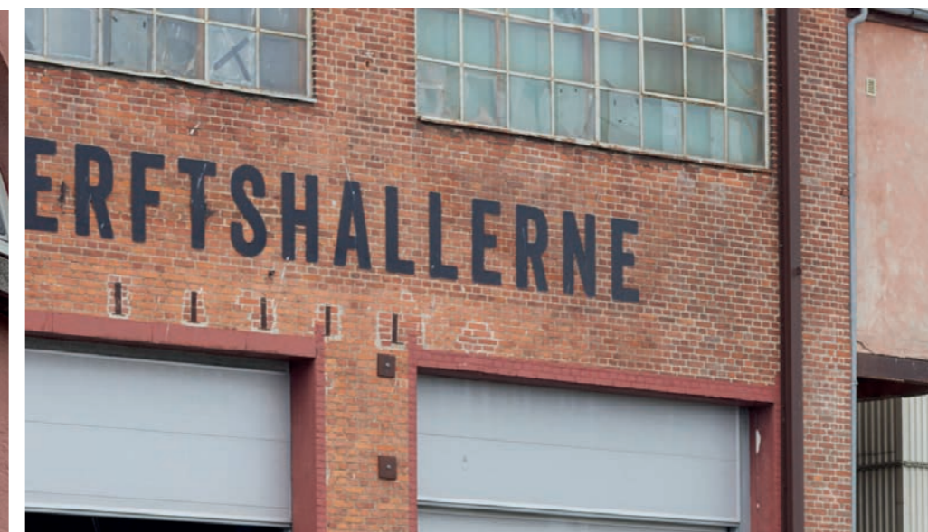
Eksempler på skiltning med enkeltstående bogstaver malet på facade