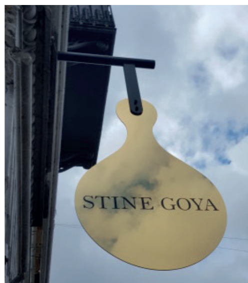
Eksempel på udhængsskilt