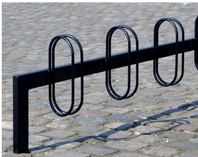
THY cykelstativ. Vinkelrette bøjler.

I bygader og lokalgader placeres cykelstativer i gadernes flexzone. Afstand mellem kørebane og stativ min. 50 cm. Afstand mellem cykelsti og stativ min. 30 cm.