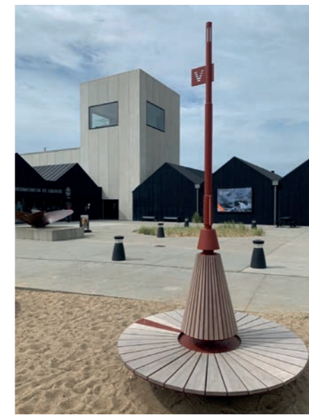
Eksempel på signaturmøbel som wayfinding.