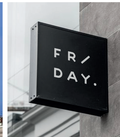
Eksempel på udhængsskilt