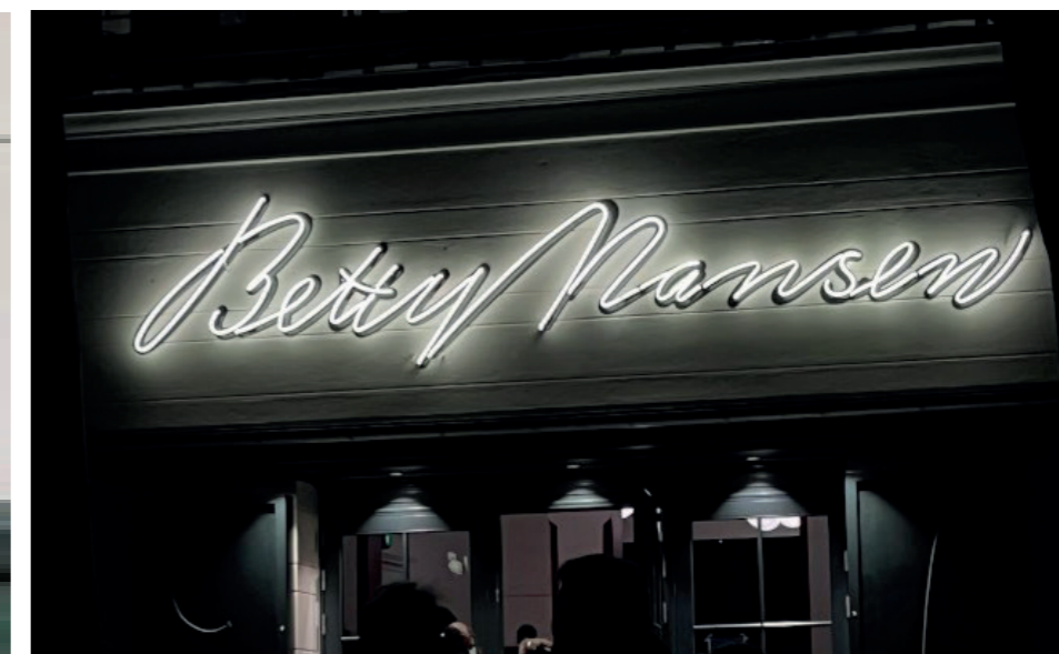
Eksempler på skiltning med lysende neonbogstaver