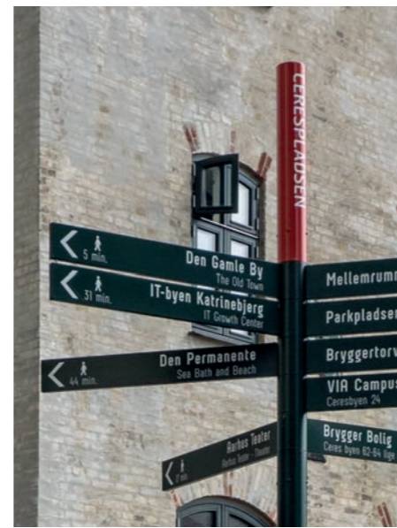
Fingerpost med særlig farve.