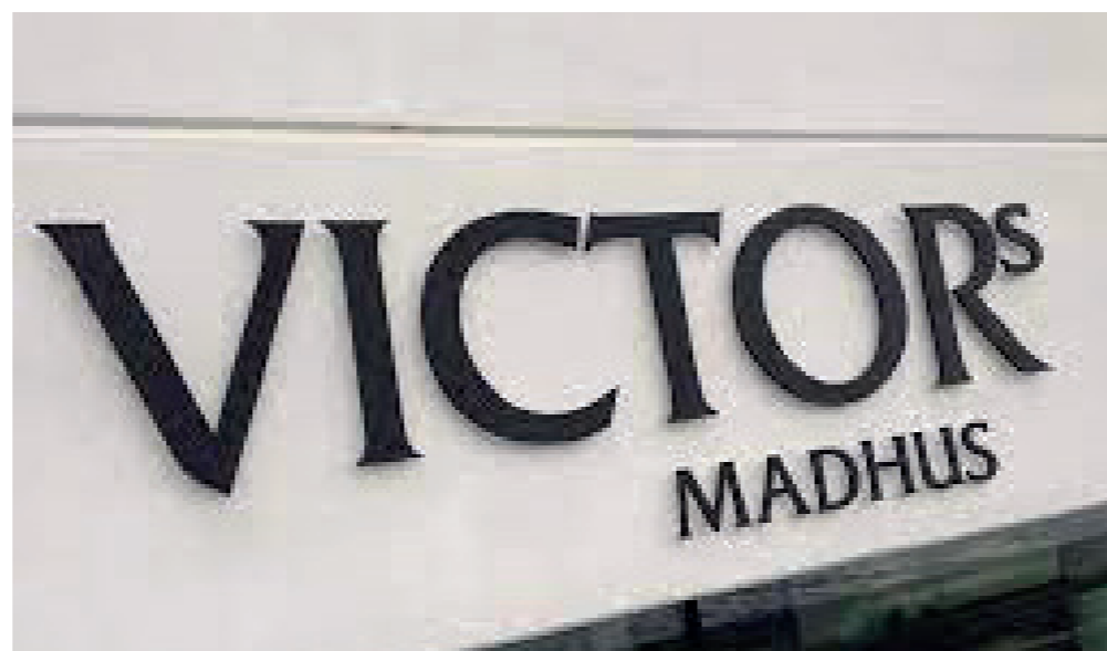
Enkeltbogstaver monteret på facade

Skiltning af større erhvervsbyggerier, som afviger fra det ovenstående, skal godkendes ifm. skitseprojekt for de enkelte delområder.