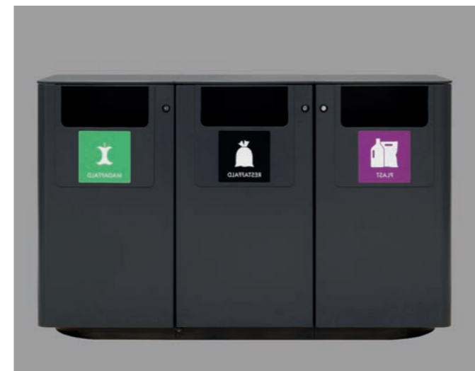
EGEDAL MILJØ 2

Frit på pladser og i den grønne korridor udenfor ganglinjer.