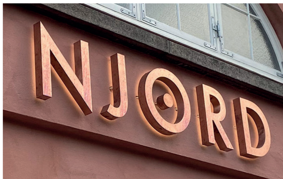
Lysende bogstaver monteret på facade