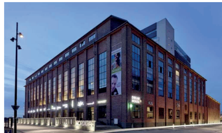
Facadeskiltning med belysning og enkeltstående bogstaver. Nordkraft Aalborg