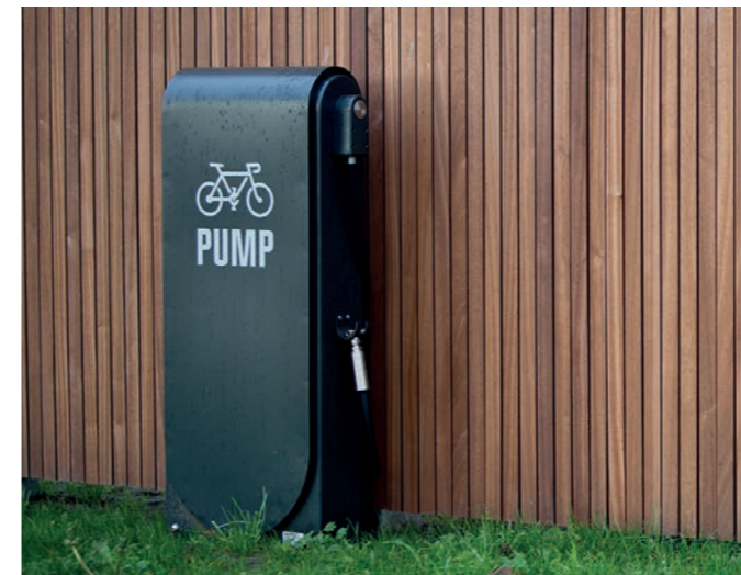
AROS kompressor luftpumpe

Placeres i cykelknodepunkter langs den primære stiforbindelse i den grønne korridor samt ved f.eks. stationsforpladsen og Kildedal Torv.