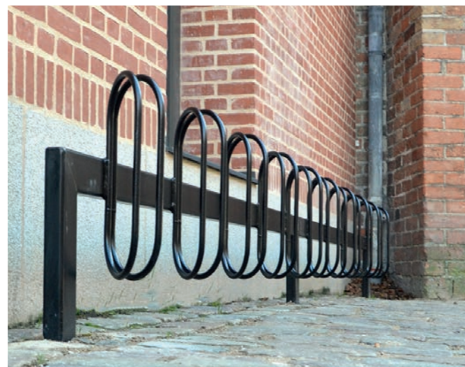
THY cykelstativ. Skråstillede bøjler.