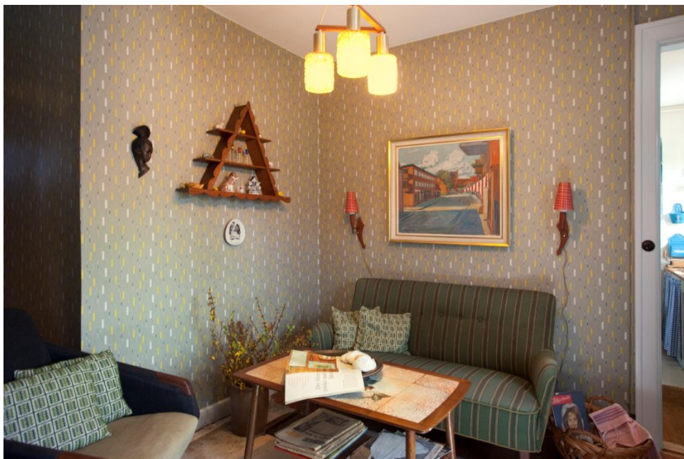
1950er stuen på Lindbjerggård.

Lige før jul blev museumslederen interviewet til Radio Ballerup om museets erindringsformidling. Interviewet blev lavet på baggrund af en artikel i "De fire årstider", der udkom i januar 2015.