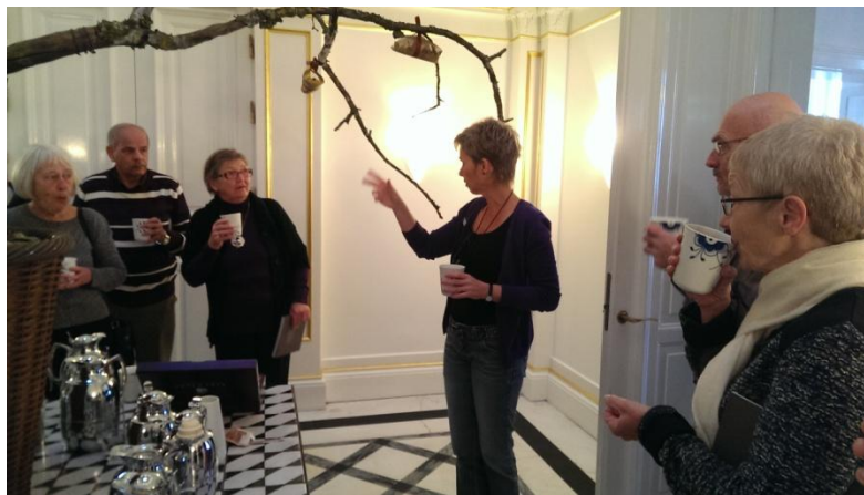
Medarbejderne til rundvisning på Hvidøre.