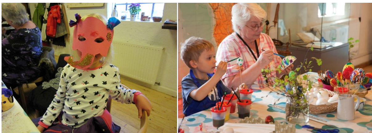
Fastelavn og påske - kreative familieaktiviteter i skolestuen.

Når foråret kommer, er der for alvor igen besøgende i Pederstrup. Museet har gennem de sidste par år benyttet påsken til at byde foråret velkommen ved at lave forskellige påskeaktiviteter – specielt for børnefamilier. I 2014 var de gamle stuer på Lindbjerggård igen pyntet op til højtiden, og i Skomagerhuset havde blomsterbinderen pyntet op til påske med naturpynt. I skolestuen bød museumsfrivillige på en aktivitetsdag med skidne æg og kreative påskesysler, og i udstillingerne kunne man gå på påskejagt efter æg og kyllinger.