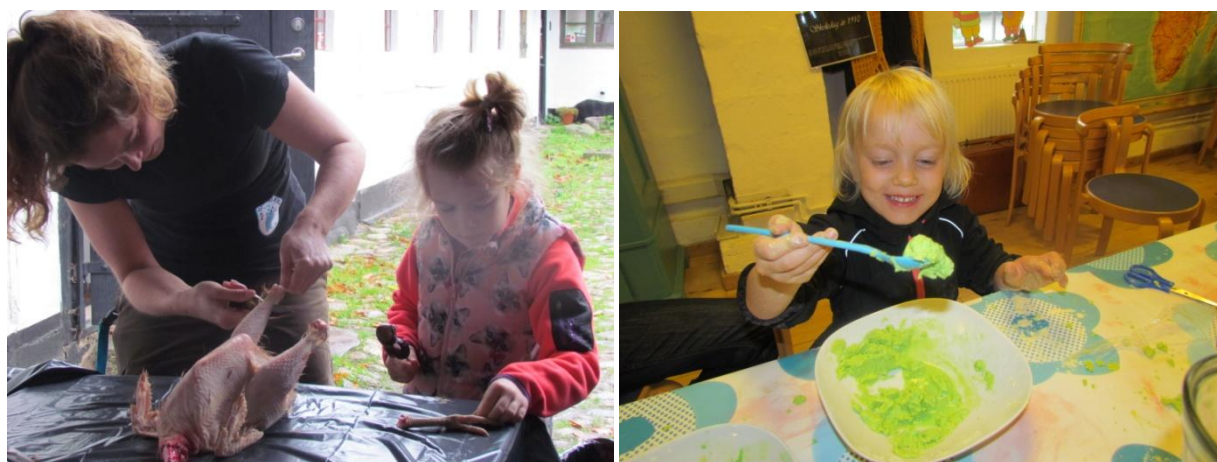
Efterårsferie føj for den!

I efterårsferien bød museet i samarbejde med naturvejlederen på aktiviteter under overskriften "Efterårsferie føj for den!" De besøgende kunne opleve de uskønne og "glemte" sider af historien fx se en høne blive slagtet og smage finker og syltede grisetæer. Udstyret med smartphonen i hånden kunne man også prøve kræfter med det ulækre historieløb, der blandt andet førte deltagerne forbi lokummet.