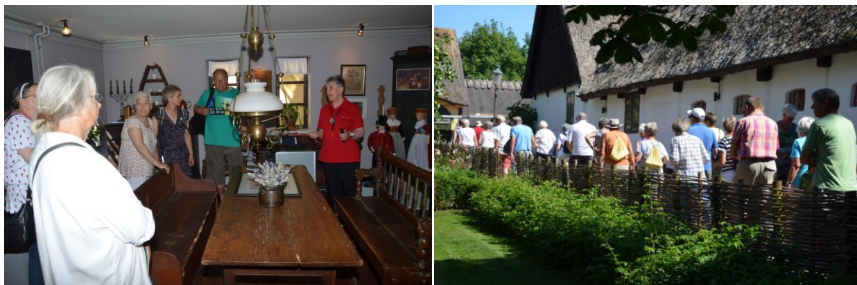
Sommerrundvisninger: "Landboliv og huekoner" og "Byvandring i Pederstrup".

Gennem hele skolesommerferien bød museet som noget nyt på en række temarundvisninger både inde og ude. Der var mulighed for at følge med på rundvisning hver tirsdag formiddag samt på udvalgte søndage. Der var rundvisninger for både børn og voksne - programmet bød blandt andet på "Landboliv og huekoner" og "Ballerup Museum fortalt i børnehøjde". Rundvisningerne var yderst velbesøgte. Det højeste besøgstal var til byvandring i Pederstrup tirsdag den 22. juli, hvor der mødte 100 deltagere op. Gennem hele perioden fik vi god presseomtale af Ballerup Bladet, der hver uge beskrev temaerne for de forskellige rundvisninger i avisen.