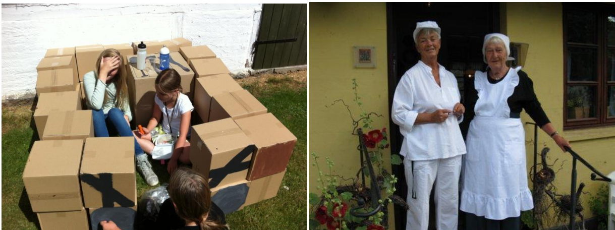
Sommerferieaktiviteter Minecraft in real life

To lærerstuderende fra UCC professionshøjskole (Blaagaard-KDAS) var i praktik i anderledes skoleformer i tre uger. De to praktikanter prøvede kræfter med museumsundervisning og stod selvstændigt for en børneworkshop på Ballerup Bibliotek om barndommen på oldemors tid.