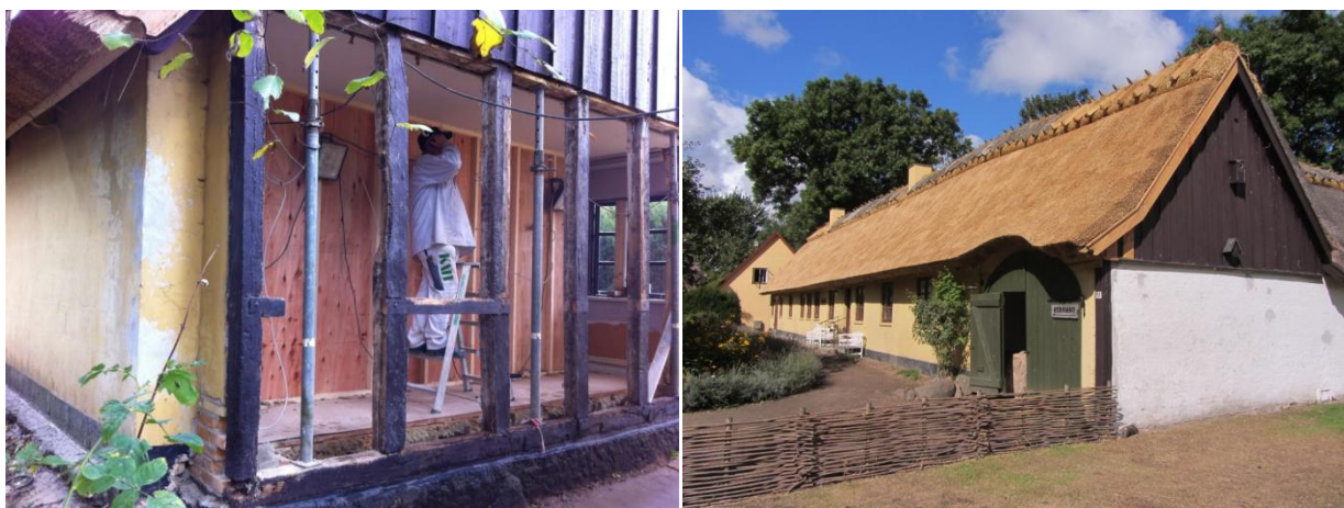
Renovering af gavlen og nyt stråtag på Lindbjerggård.

På Lindbjerggård blev den gavl på stuehuset, der vender mod Ryttergården, revet ned og genopbygget. Gavlen skilte fra det øvrige hus. Samtidig blev kælderens i huset sat i stand - affugtet og malet. Renoveringerne foregik i efteråret, og var færdige i november lige inden juleudstillingen på gården åbnede. Samtidig er Pederstrupgård, Lynsmedens Hus og Skomagerhuset blevet kalket, så bygningerne nu fremstår kridhvide.