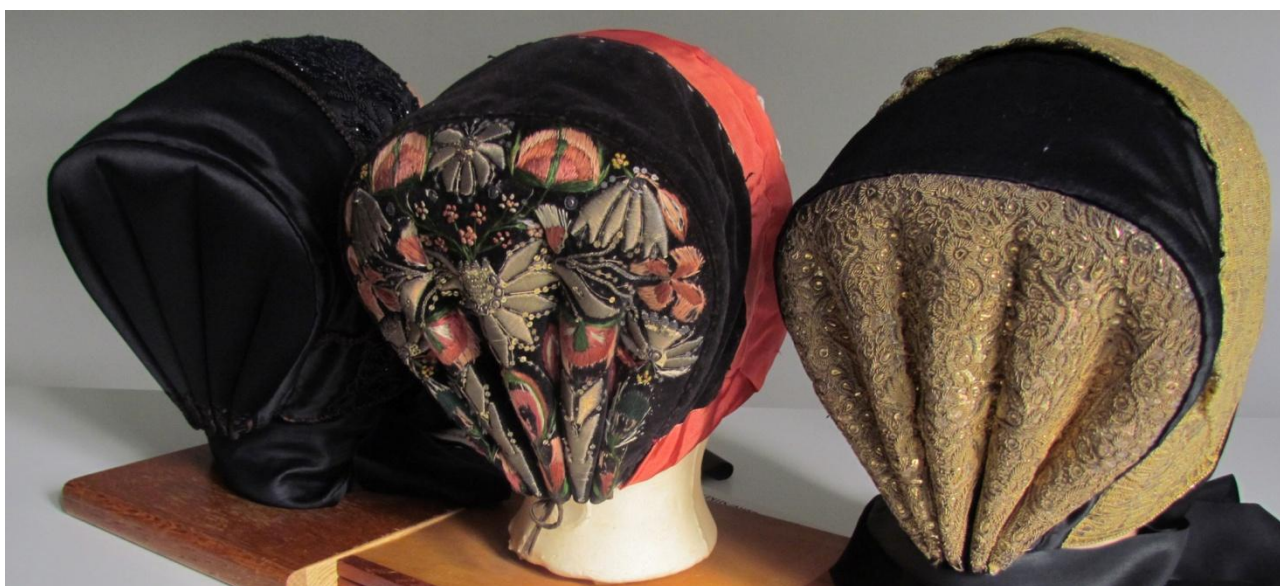
Huenakker der stammer fra sidste halvdel af 1800-tallet.