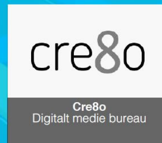
Cre8o Digitalt medie bureau

Rådgiver i forhold til optimering og udvikling af drift