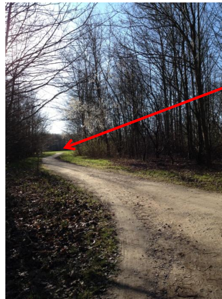
Foto taget med kig mod Ballerup Boulevard og Malmparken i nord