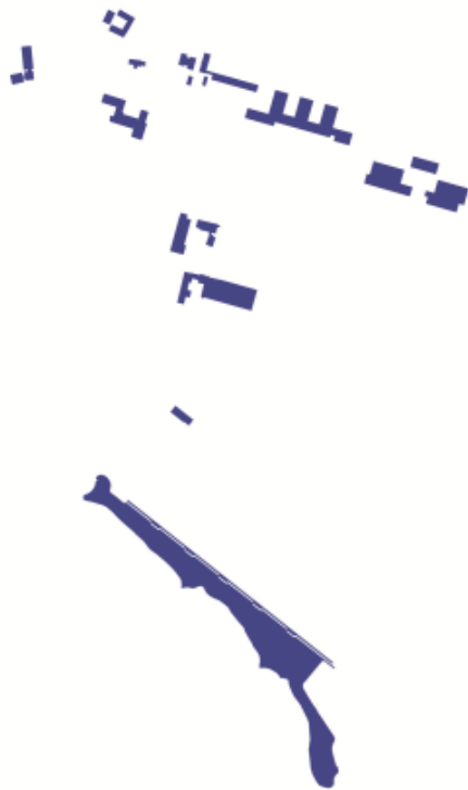
Særlige steder i Måløv i dag