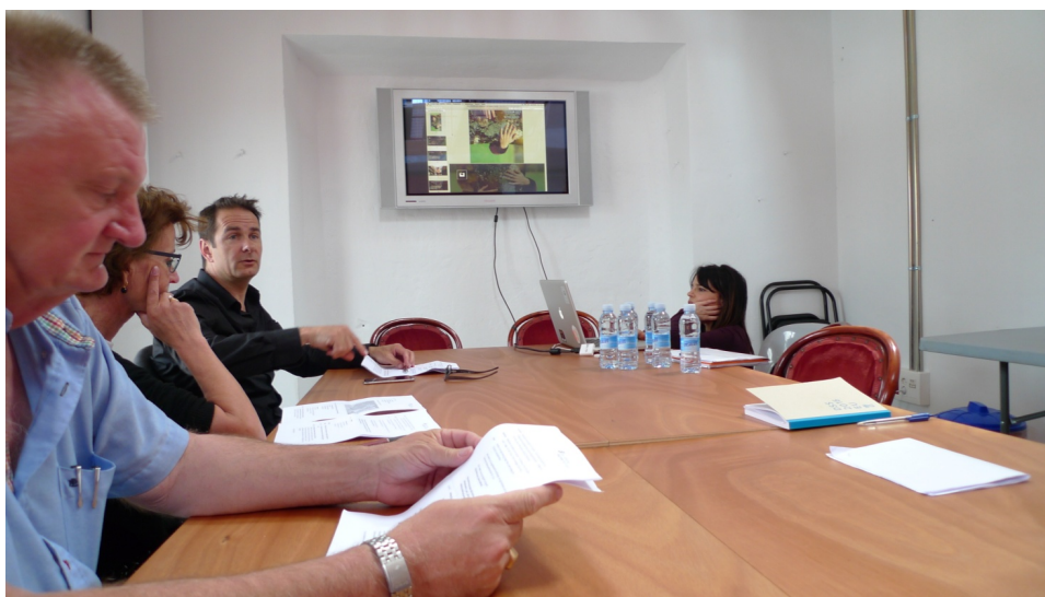
[Kultur- og Fritidsudvalget møder repræsentanter for San Sebastian/Donostia 2016]