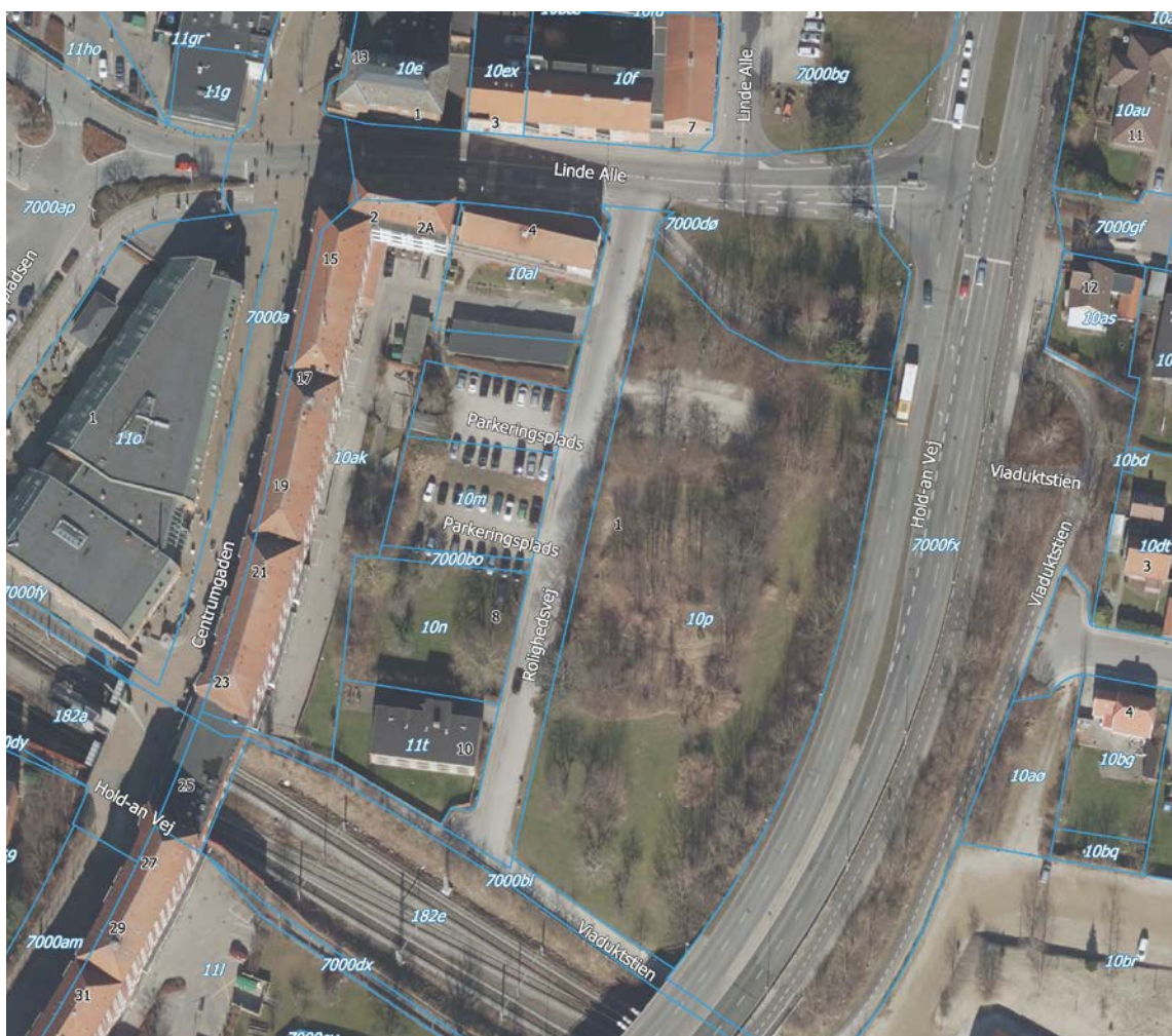
nyt enkeltområde 3.C4