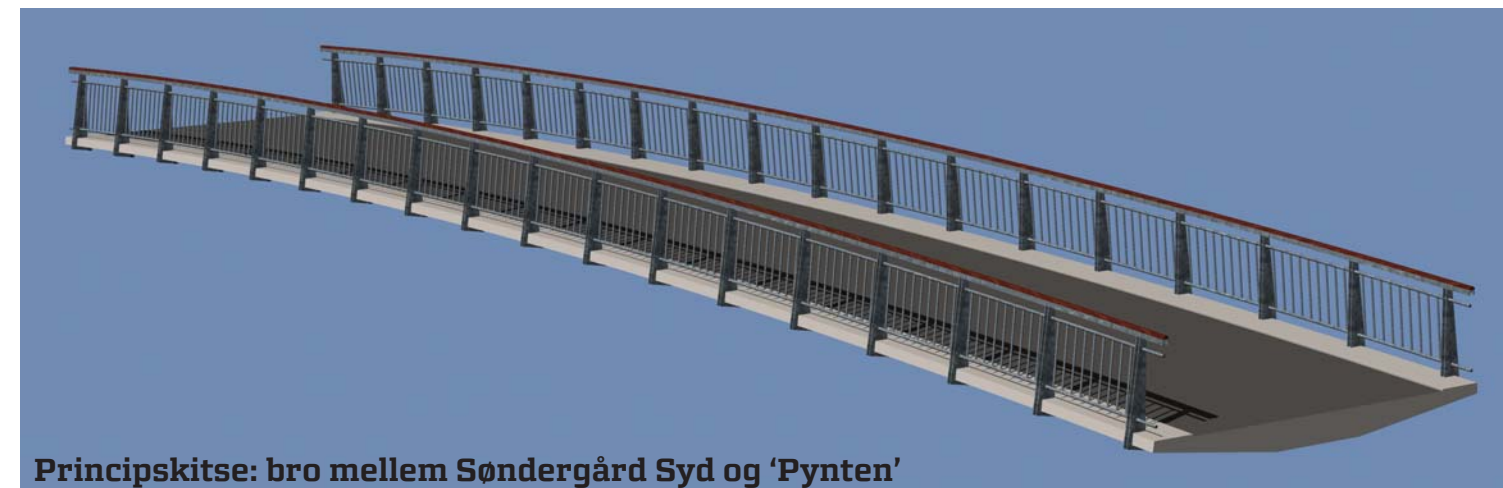
Principskitse: bro mellem Søndergård Syd og 'Pynten'