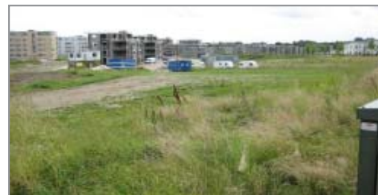
Arealer som dette bliver tilsået med græs.

Gule felter: grovregulering og midlertidig tilsåning - forår 2009 Grønne felter: færdigregulering og græs-såning - forår/sommer 2009