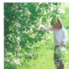
Beplantning omkring affaldspladsen

By- og Erhvervsudvikling, marts 2009/agi