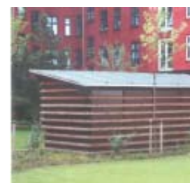
Beklædning af indhegningen