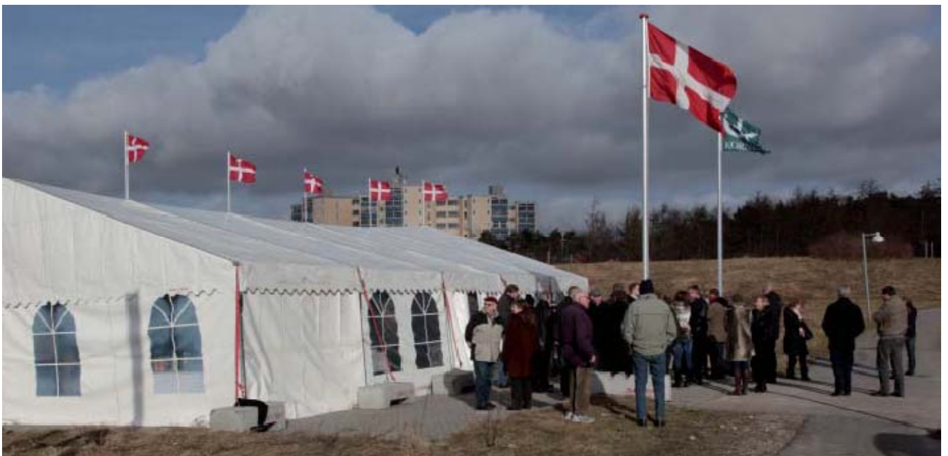
Første spadestik i smukt februarsolskin.

Der afholdes rejsegilde den 22. september i år, og bebyggelsen vil stå klar til indflytning til næste sommer.